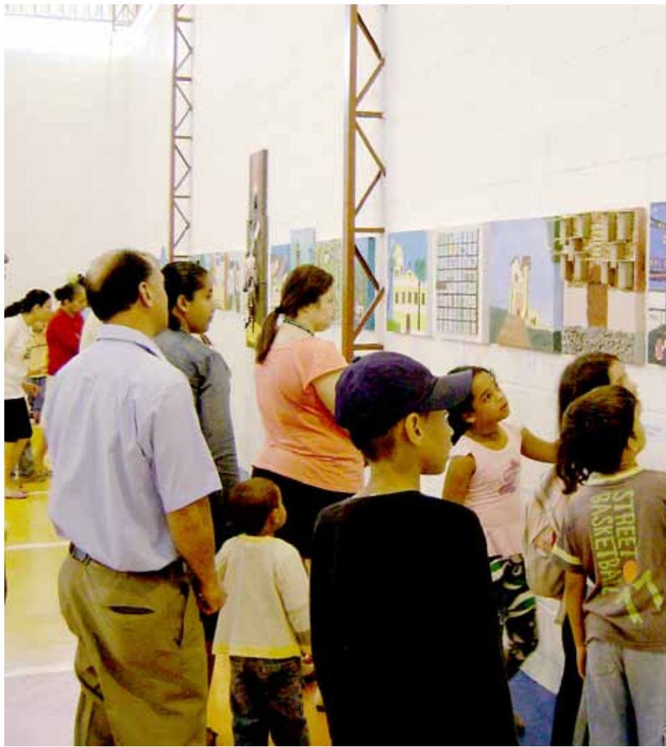
Exposição das pinturas percorreu escolas municipais

A Escola Municipal José Pereira Borba foi a campeã da Gincana Educartes 2009 – Artes Plásticas, cuja premiação aconteceu no dia 4 de novembro. Este ano a competição teve como tema “Meu Bairro”, e os alunos puderam apresentar pinturas com uma cena do seu cotidiano.