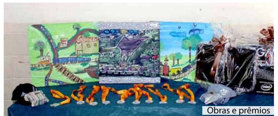
Obras e prêmios

Este ano, a gincana contou com uma exposição itinerante dos trabalhos de todas as escolas do município. Durante o mês de setembro a exposição visitou os pólos Jardim Jacira, Valo Velho e Centro, passando por 16 unidades escolares.