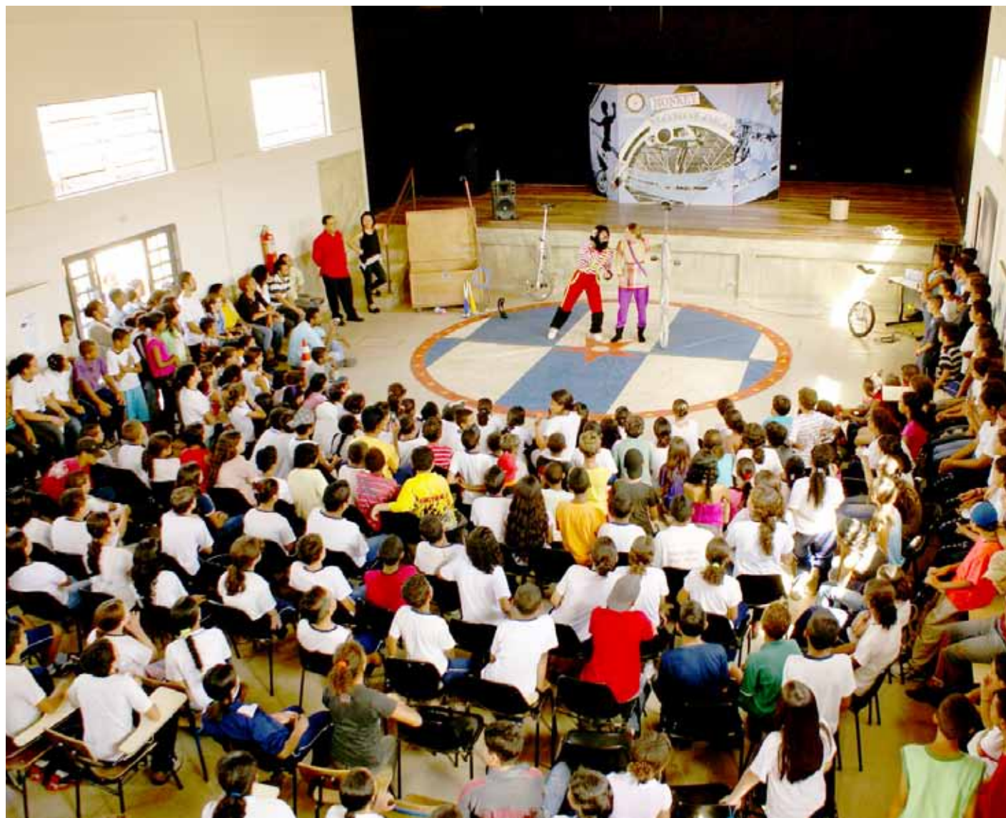
Espaços Culturais do município receberam apresentação da Cia Monkey Monoloco

Entre os dias 26 de outubro e 7 de novembro, Itapecerica da Serra se transformou na capital do teatro. A IV Mostra realizada pela Prefeitura, por meio da Secretaria de Cultura, teve apresentação de diversas peças, intervenções culturais nas praças públicas e Workshop de Palhaços.