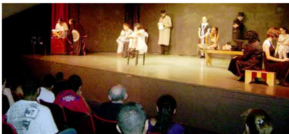
Maioria das peças foi apresentada no Cine Teatro

Entre atuações dos alunos das Oficinas Culturais da cidade e grupos convidados, a IV Mostra de Teatro de Itapecerica da Serra contou com as seguintes peças: “Esperando Nelson Motta”, “Rapto do Nariz Vermelho”, “Sonhos”, “Internato Feminino”, “Experimental”, “Como Nasce Um Cabra da Peste”, “Monkey Monoloko”, “Shakespeare em Fragmentos” e “Páginas Esquecidas”.