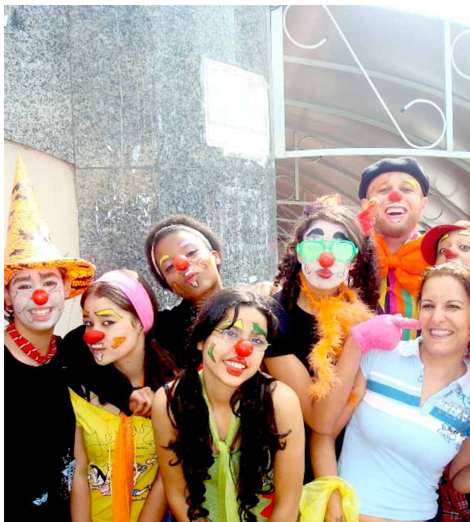
Intervenções nas praças da cidade divertiram os munícipes

Outro filme que agradou o público foi “O Quarto do Jobi – O Quarto Escuro”. O curta arrancou boas gargalhadas e garantiu o sucesso do evento, proporcionando uma oportunidade ímpar para o conhecimento das técnicas, estilos e histórias do gênero.