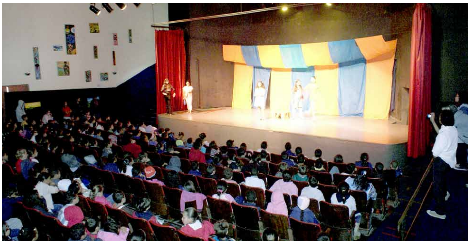
Apresentações teatrais lotaram o Cine Teatro (foto) e os Espaços Culturais da cidade