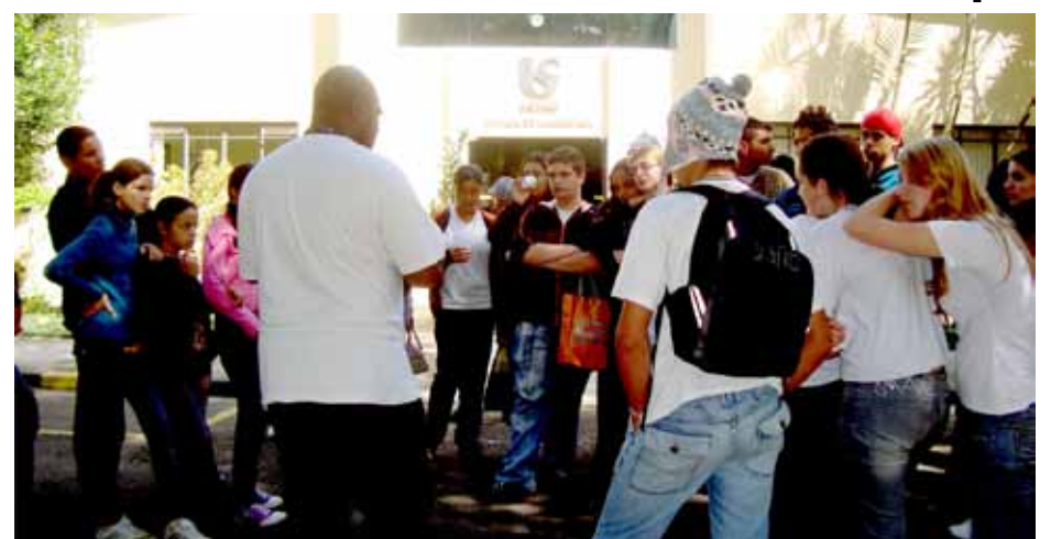
Alunos acompanharam explicações e o tratamento da água

A visita foi propiciada pelo projeto que a Sabesp desenvolve junto à FUNASA – Fundação Nacional de Saúde, que visa fortalecer a Educação Ambiental para que os alunos de toda rede de ensino possam aprender o valor do bem natural fundamental para vida do ser humano.