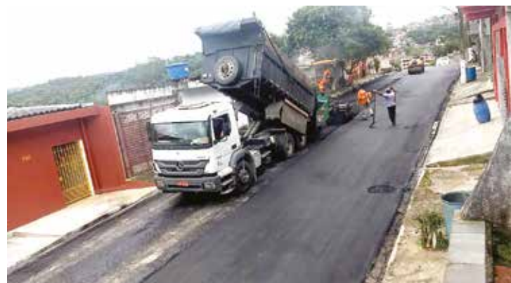
Obra de recapeamento no Jardim das Oliveiras

O portal oficial online da Prefeitura ( www.itapecerica.sp.gov.br ) ganhou recentemente um recurso para a divulgação de melhorias pela cidade: o Mapa de Obras. A ferramenta deixa o munícipe por dentro de todo o trabalho de obras e serviços realizado em Itapeçerica da Serra. Recapeamento asfáltico, limpeza de bueiro, operação tapa buraco, entre outras ações coordenadas pela Secretaria de Obras e Serviços Urbanos.