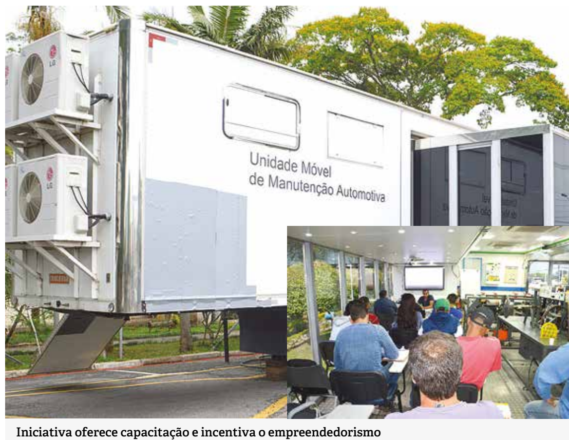
Iniciativa oferece capacitação e incentiva o empreendedorismo

Itapececericanos receberam certificados reconhecidos pelo Centro Paula Souza