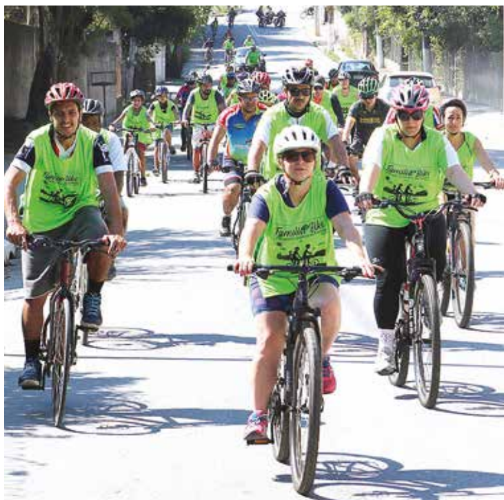
Capacete, colete e bicicleta revisada foram itens obrigatórios no ato da inscrição