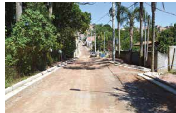
Rua da Cachoeira, Recreio Campestre, recebeu guias e sarjetas; próxima etapa é a pavimentação

Clicando em um dos balões, o usuário tem acesso à data na qual a obra foi iniciada, a descrição sobre o que está sendo realizado no local e até mesmo a rota para que possa ser realizada a supervisão do trabalho pela população.