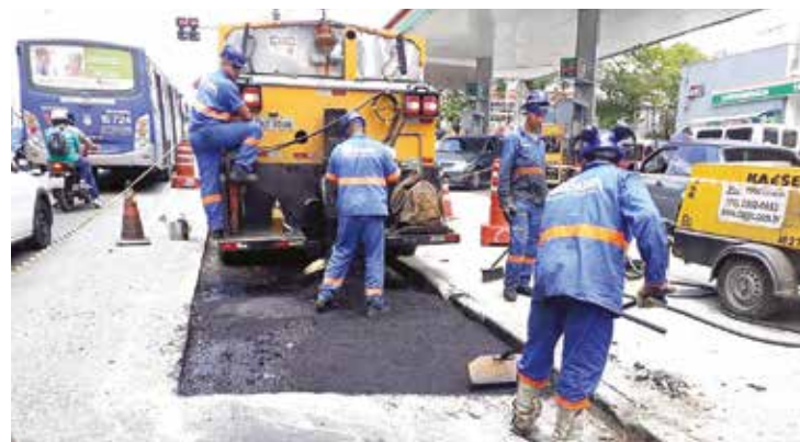
Operação Tapa Buraco na região do Valo Velho

Dois meses após lançamento, Mapa de Obras revela mais de 200 serviços