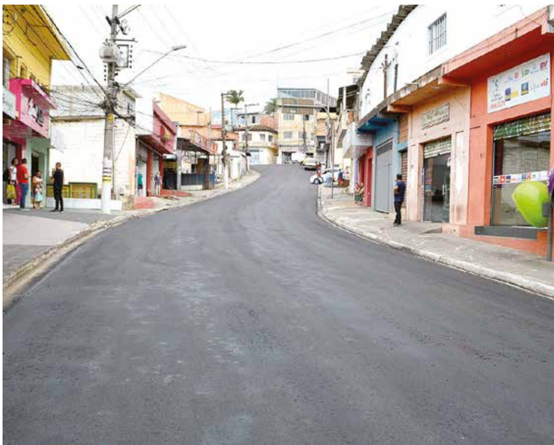
Nova camada asfáltica contemplara toda extensão da rua

Outra via de grande circulação na cidade, a Estrada dos Mandu, já está no cronograma de ação e será a próxima a ser recuperada.