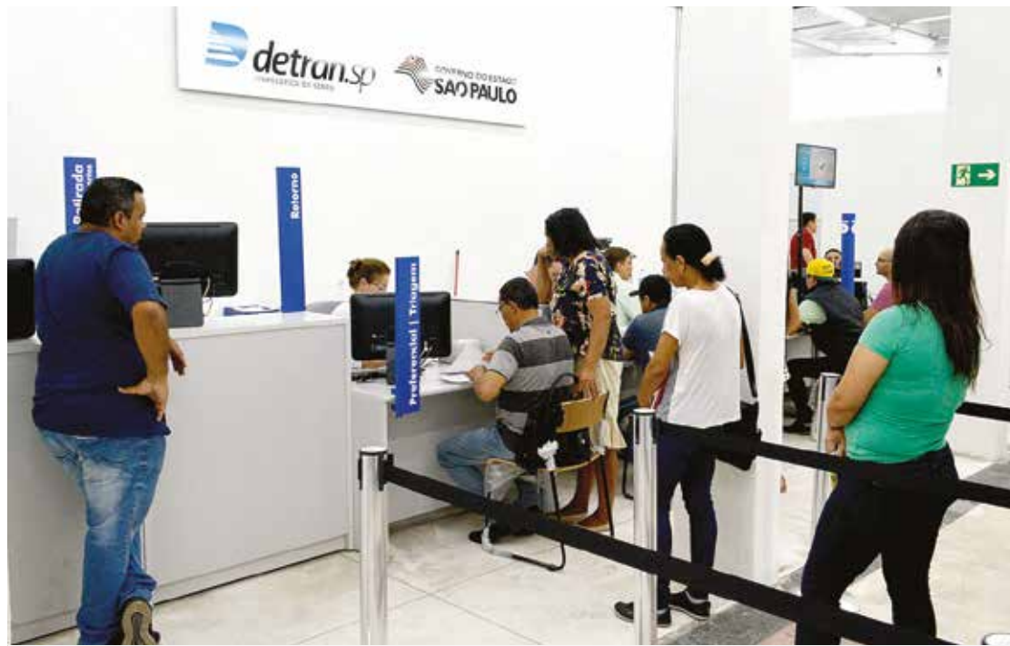
Posto de Atendimento do Detran.SP está localizado na rua 13 de Maio, nº 100

Órgão substitui o Ciretran e oferece mais serviços com melhor infraestrutura de atendimento