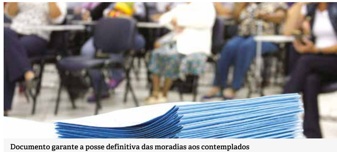
Documento garante a posse definitiva das moradias aos contemplados

Em 2018 foram contemplados com o documento 188 famílias. “Hoje saiu o tão sonhado documento. Primeiramente