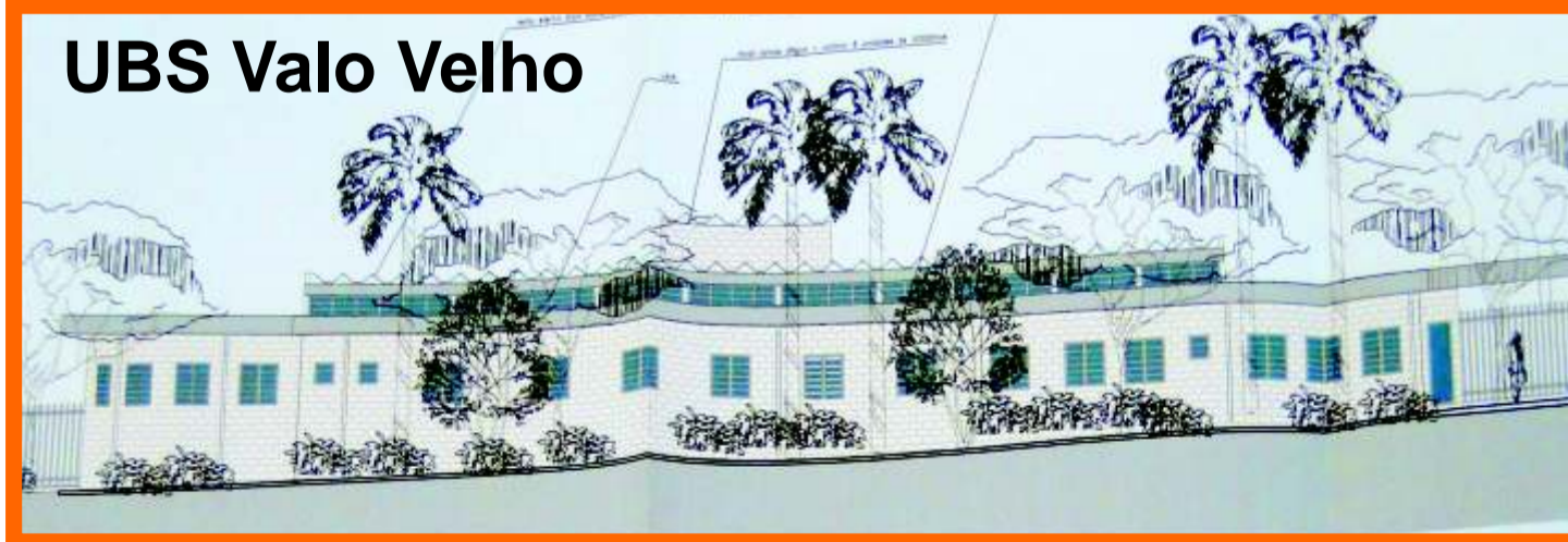
UBS Valo Velho