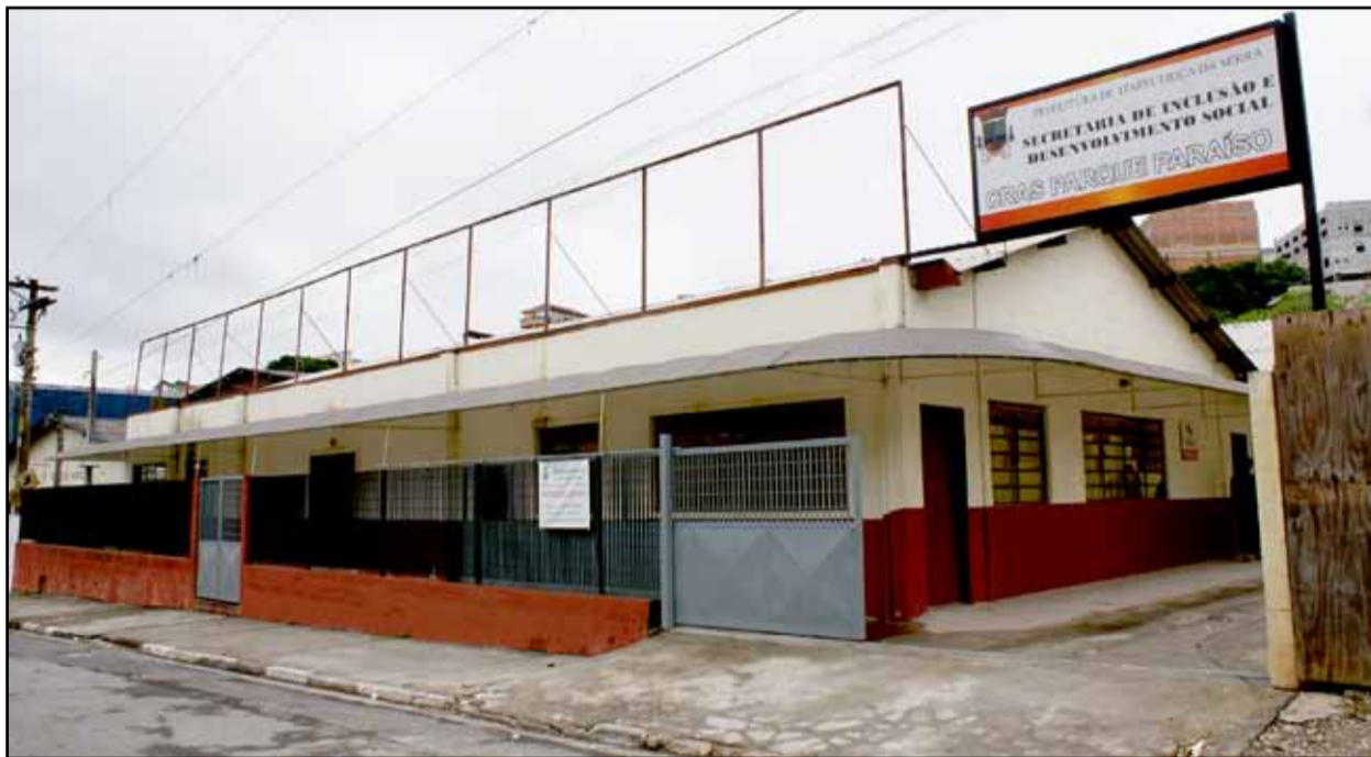
CRAS e CREAS do Parque Paraíso

No dia 26, foi a vez do CRAS Valo Velho inaugurar o novo espaço, localizado na avenida Soldado PM Gilberto Augustinho. O prédio, que foi totalmente reformado, conta também com cursos de crochê, tricô, artesanato em jornal, entre outras atividades.