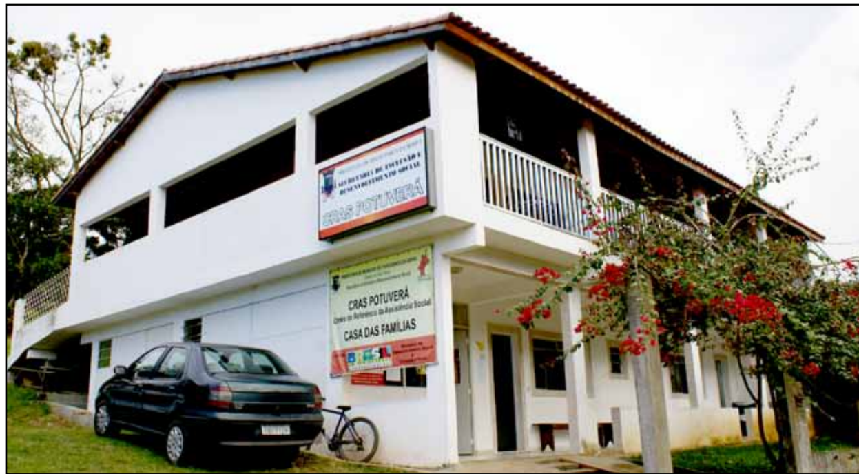
CRAS do Potuverá