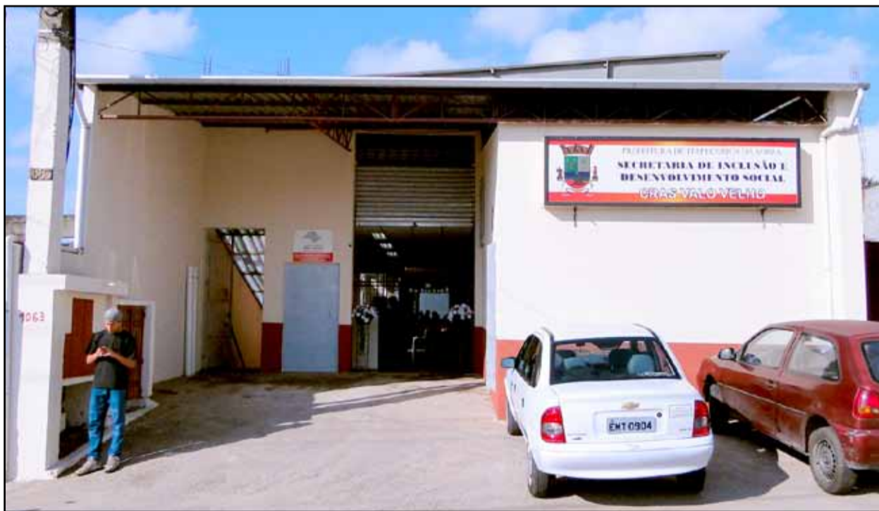
CRAS do Valo Velho