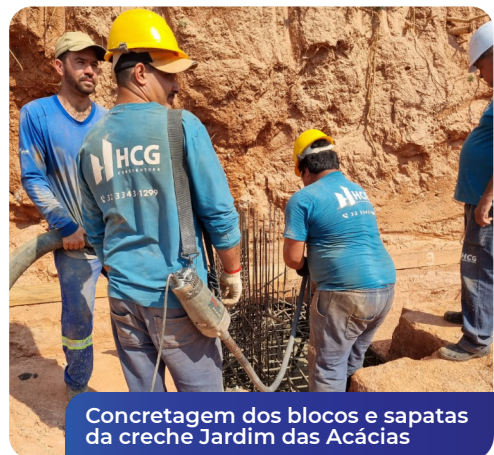
Concretagem dos blocos e sapatas da creche Jardim das Acácias