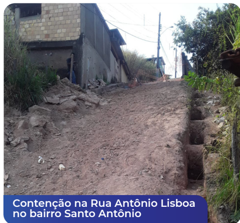
Contenção na Rua Antônio Lisboa no bairro Santo Antônio