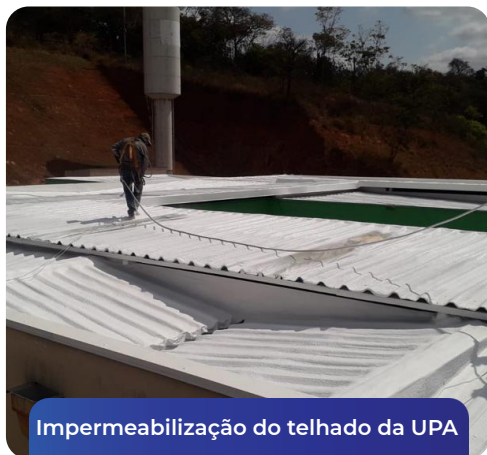
Impermeabilização do telhado da UPA