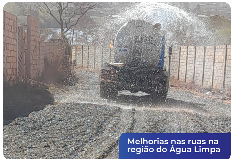
Melhorias nas ruas na região do Água Limpa