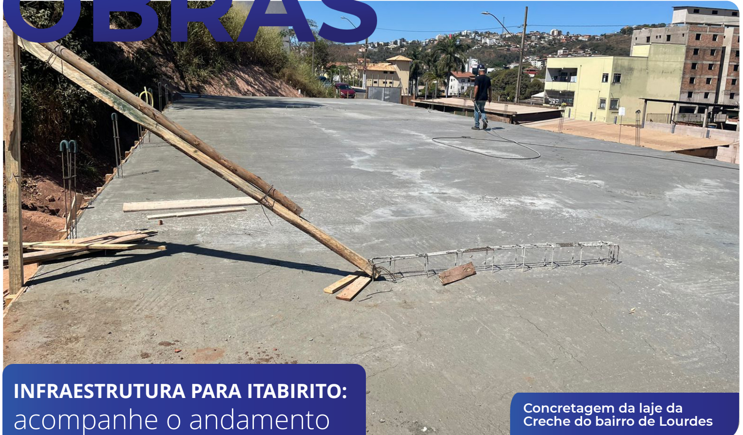
INFRAESTRUTURA PARA ITABIRITO: acompanhe o andamento de obras pela cidade.