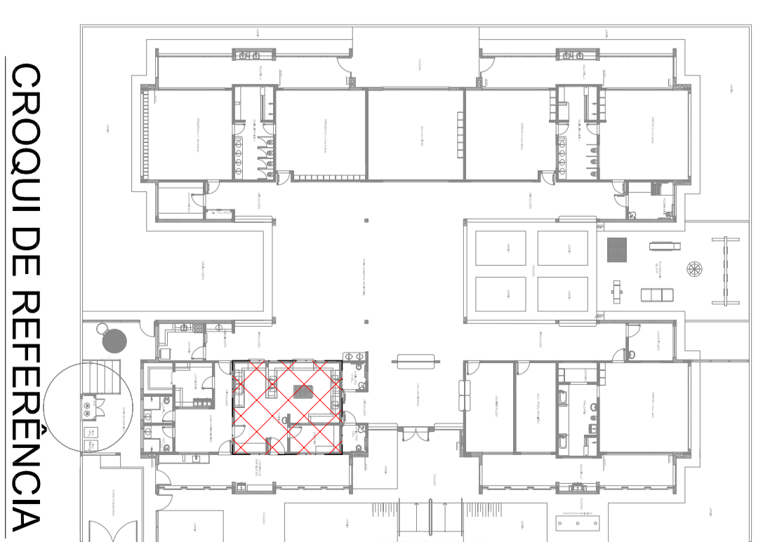
CROQUI DE REFERÊNCIA