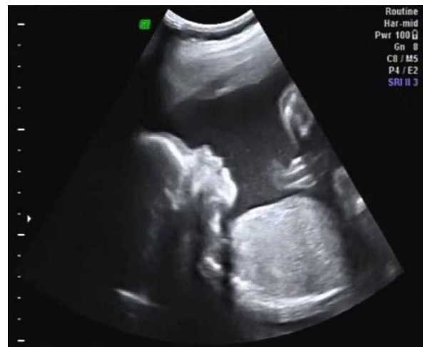
Figura 1: Ultrassonografia gestacional.

O Programa do Pré-natal (PN) realiza o acompanhamento de saúde da gestante e feto, desde o momento de confirmação da gravidez até o parto e, posteriormente no período pós-parto, fase do acompanhamento puerperal.