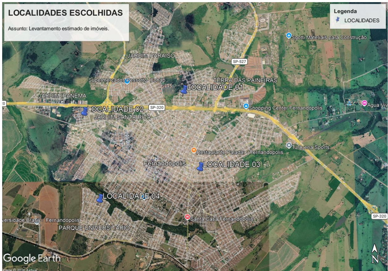
Imagem 1: Localidades escolhidas para levantamento.

Buscando contemplar diferentes localidades, realizamos o levantamento em 4 (quatro) pontos do município, adotando-se um raio de abrangência de 150 metros, conforme solicitado.