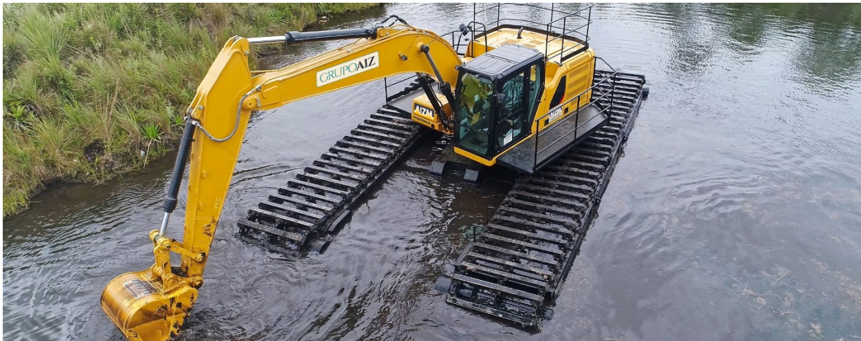
Figura 2 – Exemplo de escavadeira hidráulica anfíbia.

Esta ação preventiva deve ser mantida até que o reflorestamento no local seja concluído e seja capaz de amortecer as cheias e evitar o assoreamento, assegurando assim a preservação da represa Beira Rio.