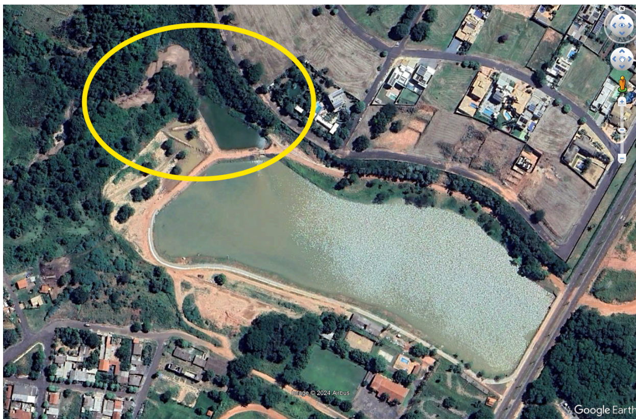
Figura 1 – Localização da barragem/represa de contenção de sedimentos.

Dentre as infraestruturas instaladas na recuperação ambiental está uma pequena barragem de contenção de sedimentos (Figura 1), que tem a finalidade de impedir novos assoreamentos. Essa caixa precisa ser constantemente limpa durante o período chuvoso, que se aproxima, pois se ela for preenchida por sedimentos, reduz a capacidade de amortecimento de cheias e poderá se romper, resultando de destruição de parte da infraestrutura, reassoreamento da represa e prejuízos socioeconômicos e ambientais.