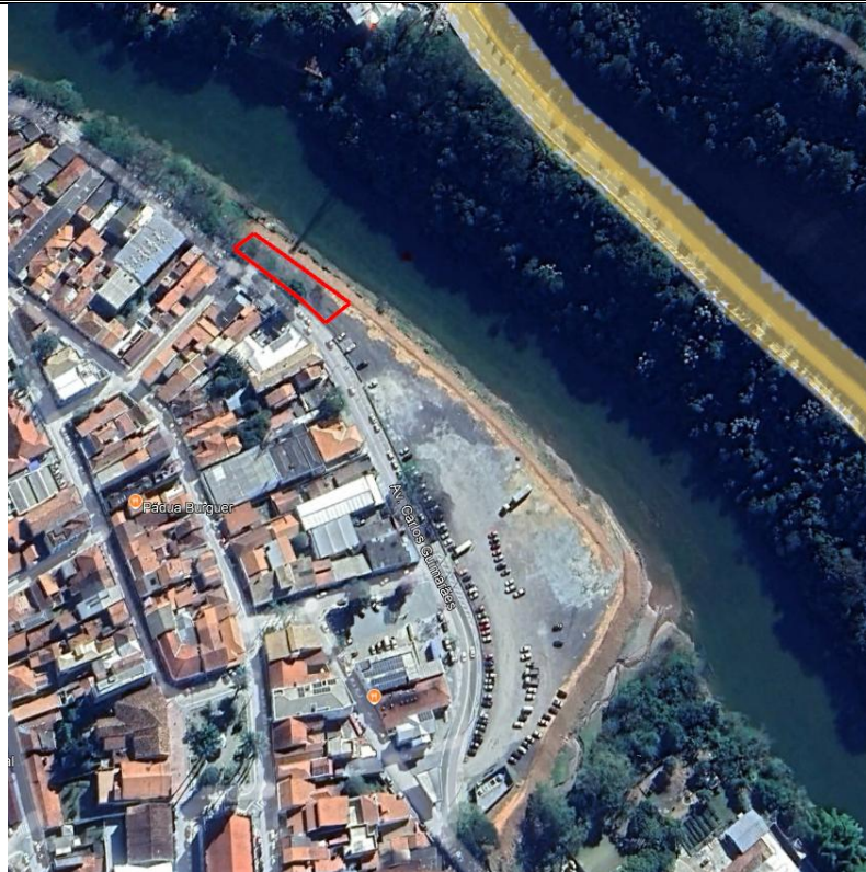
Imagem nº 01 - Imagem aérea coletada do programa Google Earth demonstrando local a ser executada obra