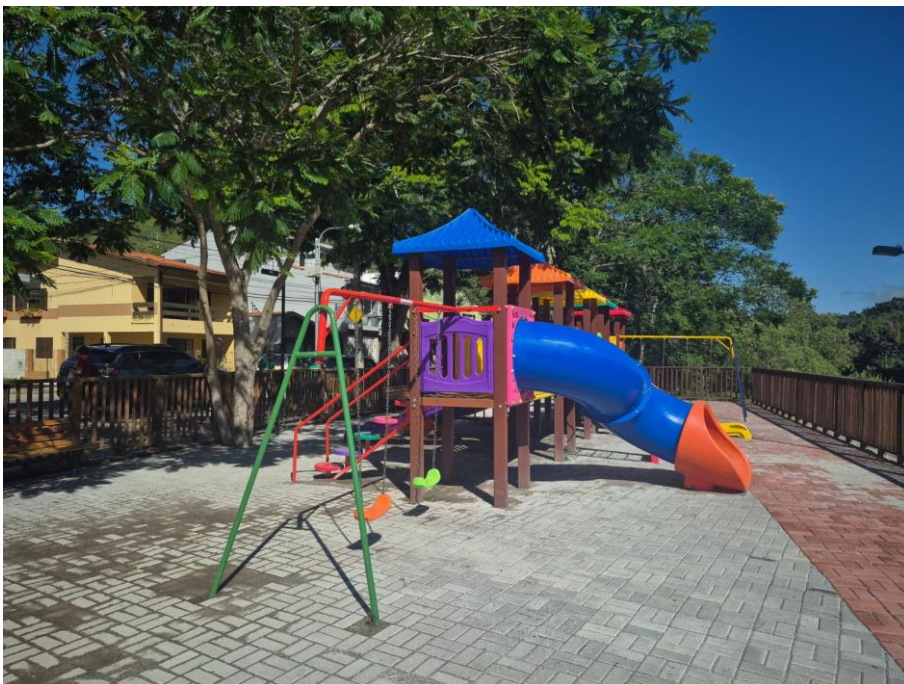
Foto nº 05 - Vista do local por outro ângulo