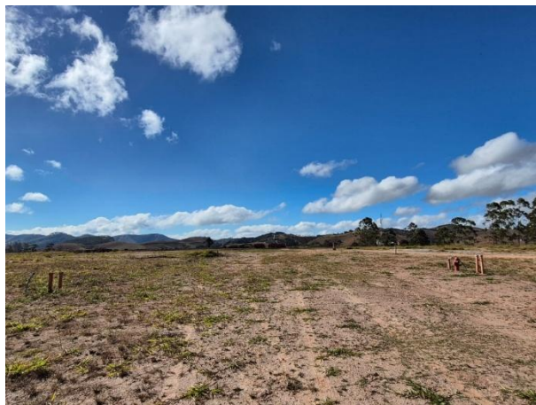
Foto nº 07- Vista da área a ser pavimentada