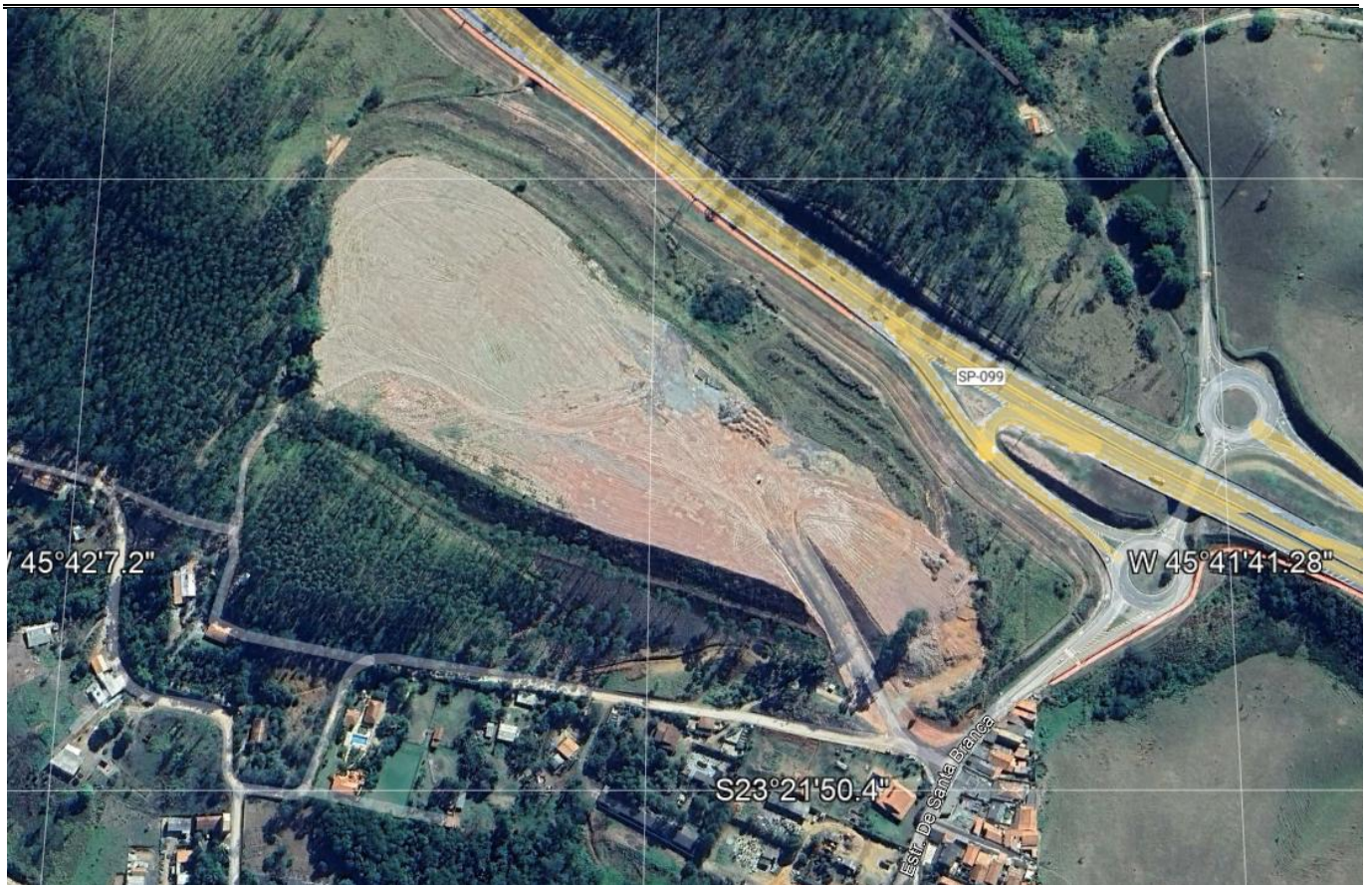
Imagem nº 01 - Imagem aérea coletada do programa Google Earth demonstrando o local onde será realizada a pavimentação