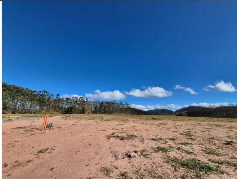
Foto nº 06- Vista por outro ângulo da área a ser pavimentada