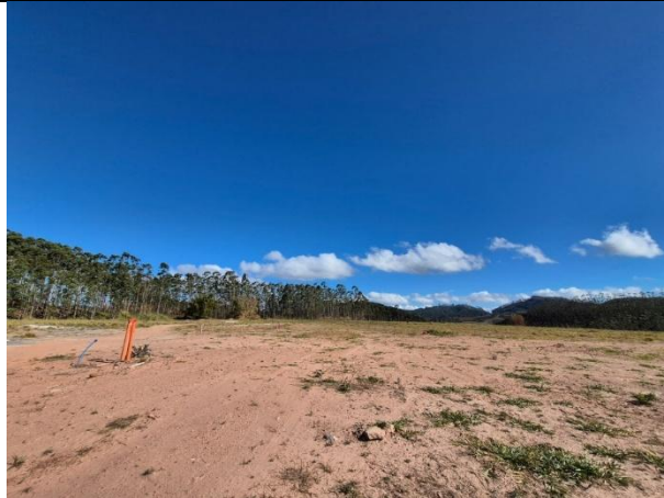
Foto nº 06- Vista por outro ângulo da área a ser pavimentada