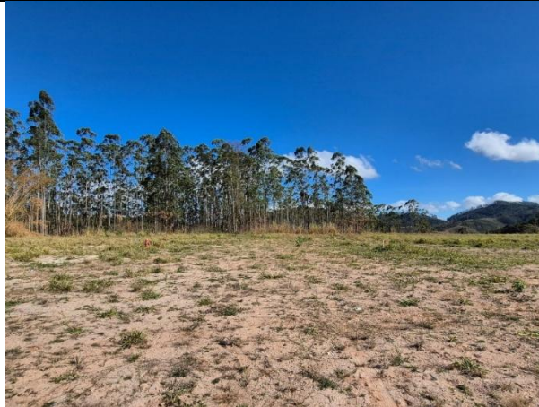
Foto nº 09- Fim da área a ser pavimentada