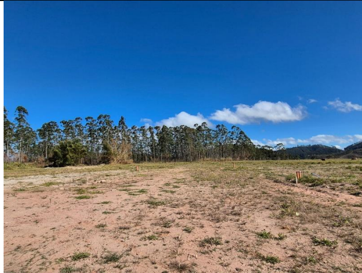
Foto nº 08- Vista da área a ser pavimentada