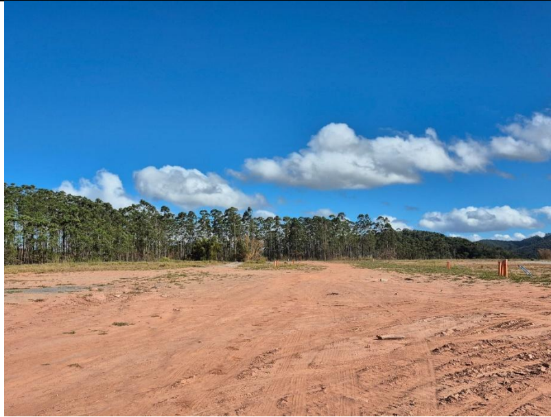
Foto nº 04- Vista por outro ângulo da área a ser pavimentada