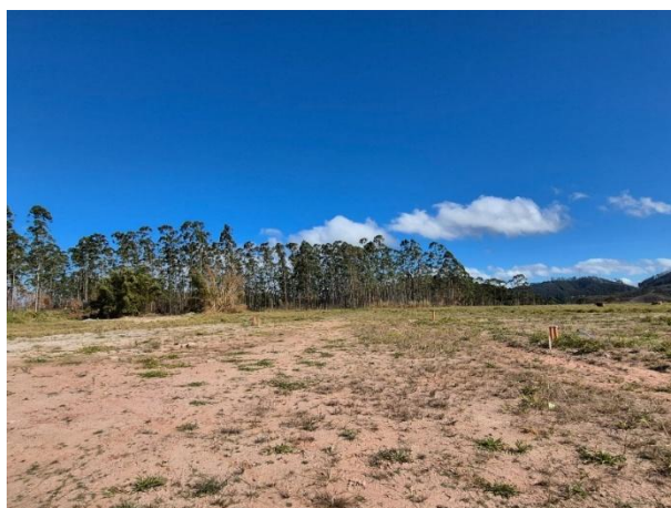
Foto nº 08- Vista da área a ser pavimentada