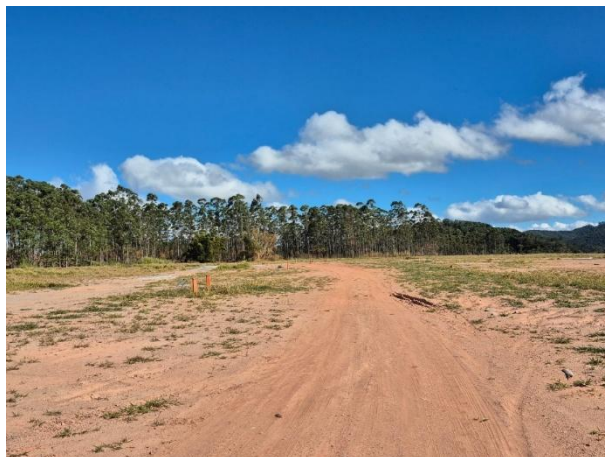
Foto nº 05- Vista por outro ângulo da área a ser pavimentada