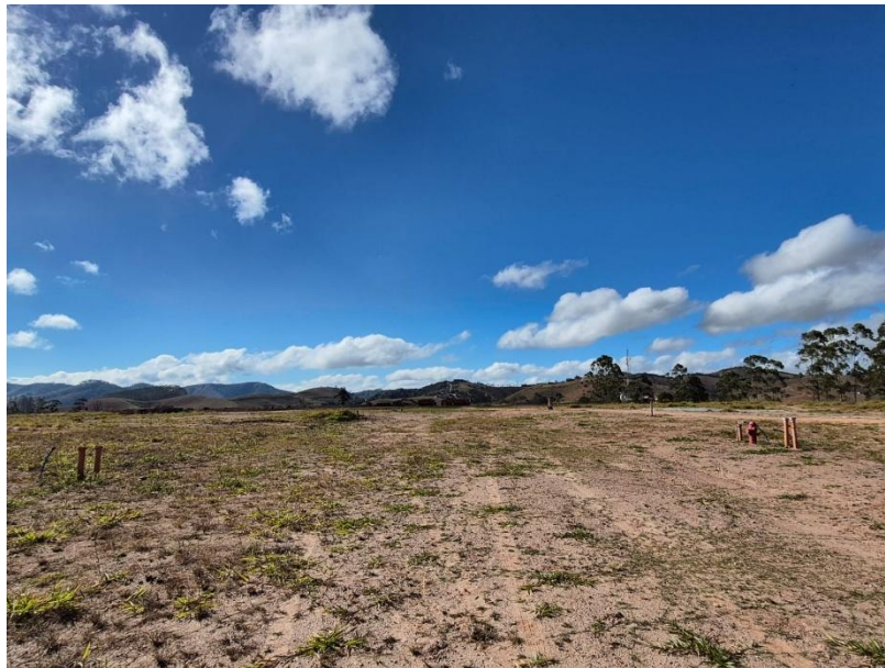
Foto nº 07- Vista da área a ser pavimentada