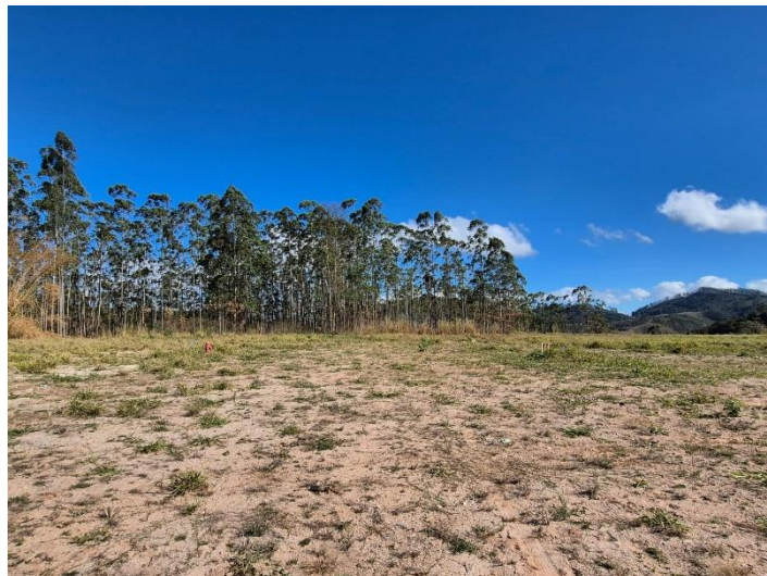
Foto nº 09- Fim da área a ser pavimentada