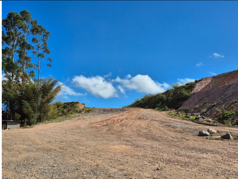
Foto nº 02- Vista do início da área a ser pavimentada