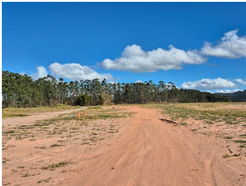
Foto nº 05- Vista por outro ângulo da área a ser pavimentada