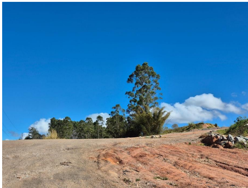
Foto nº 01 - Vista do início da área a ser pavimentada