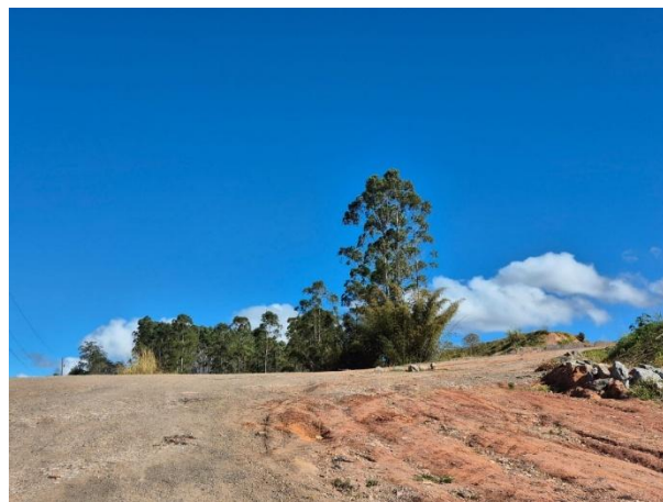
Foto nº 01- Vista do início da área a ser pavimentada