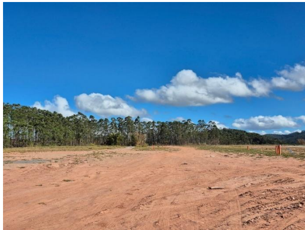
Foto nº 04- Vista por outro ângulo da área a ser pavimentada