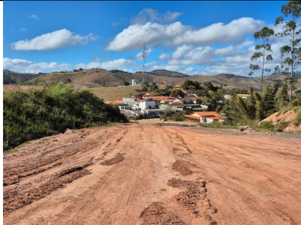
Foto nº 03- Área por outro ângulo da rua a ser pavimentada