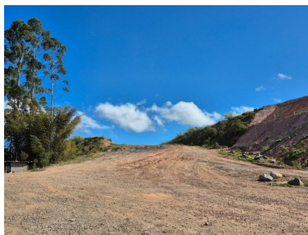
Foto nº 02- Vista do início da área a ser pavimentada