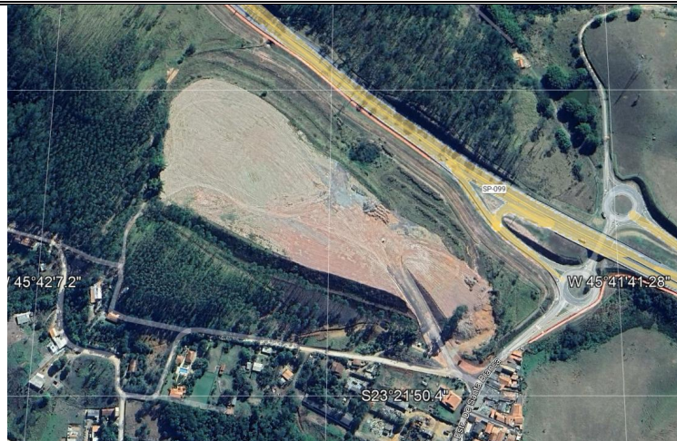
Imagem nº 01- Imagem aérea coletada do programa Google Earth demonstrando o local onde será realizada a pavimentação