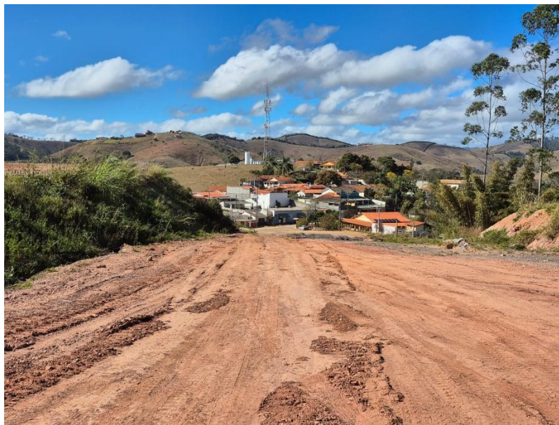
Foto nº 03- Área por outro ângulo da rua a ser pavimentada