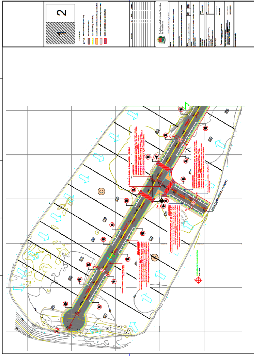
Imagem nº 02- Imagem de parte do projeto de pavimentação.