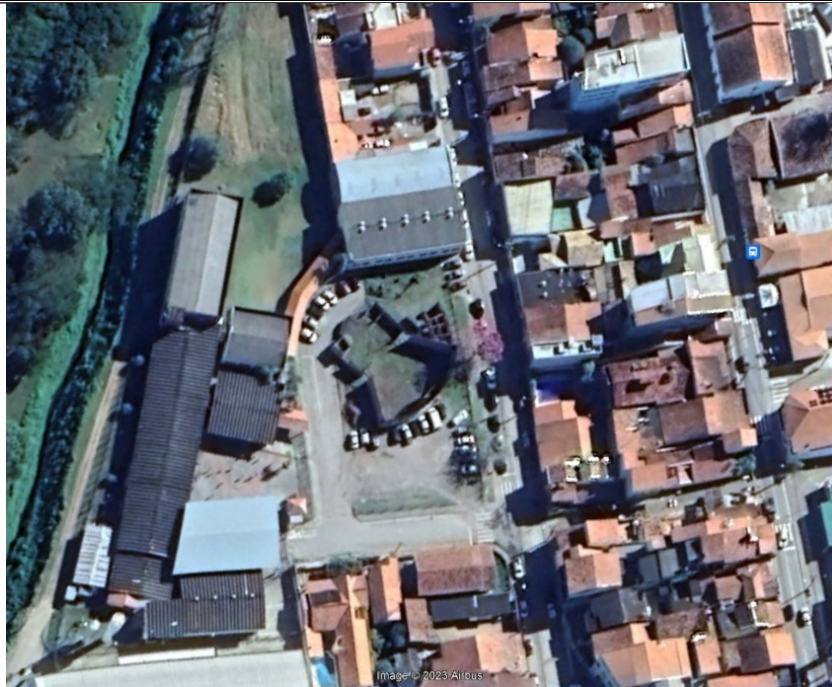
Imagem nº 01- Imagem aérea coletada do programa Google Earth demonstrando a área do futuro Teatro Municipal