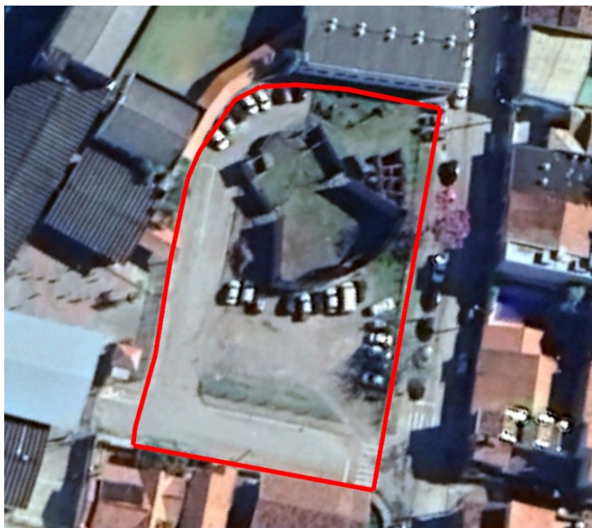
Imagem nº 02- Imagem aérea coletada do programa Google Earth demonstrando a área do futuro Teatro Municipal