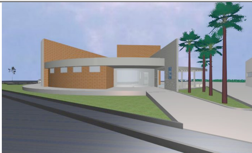
Imagem nº 04- Imagem Ilustrativa do Teatro (estrutura construída)