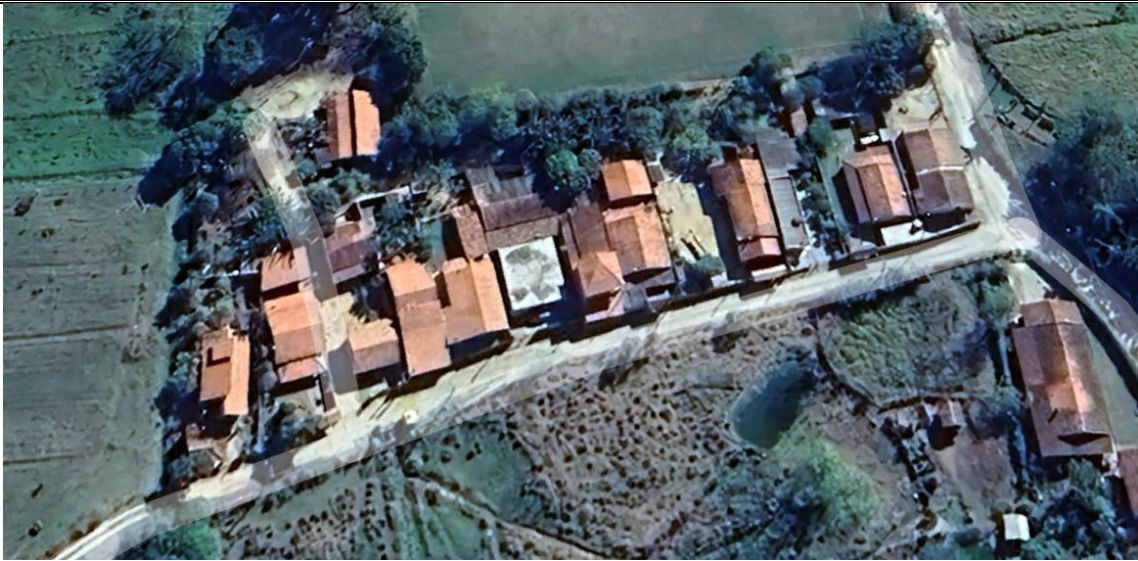
Imagem nº 01 - Imagem aérea coletada do programa Google Earth demonstrando a rua a ser pavimentada