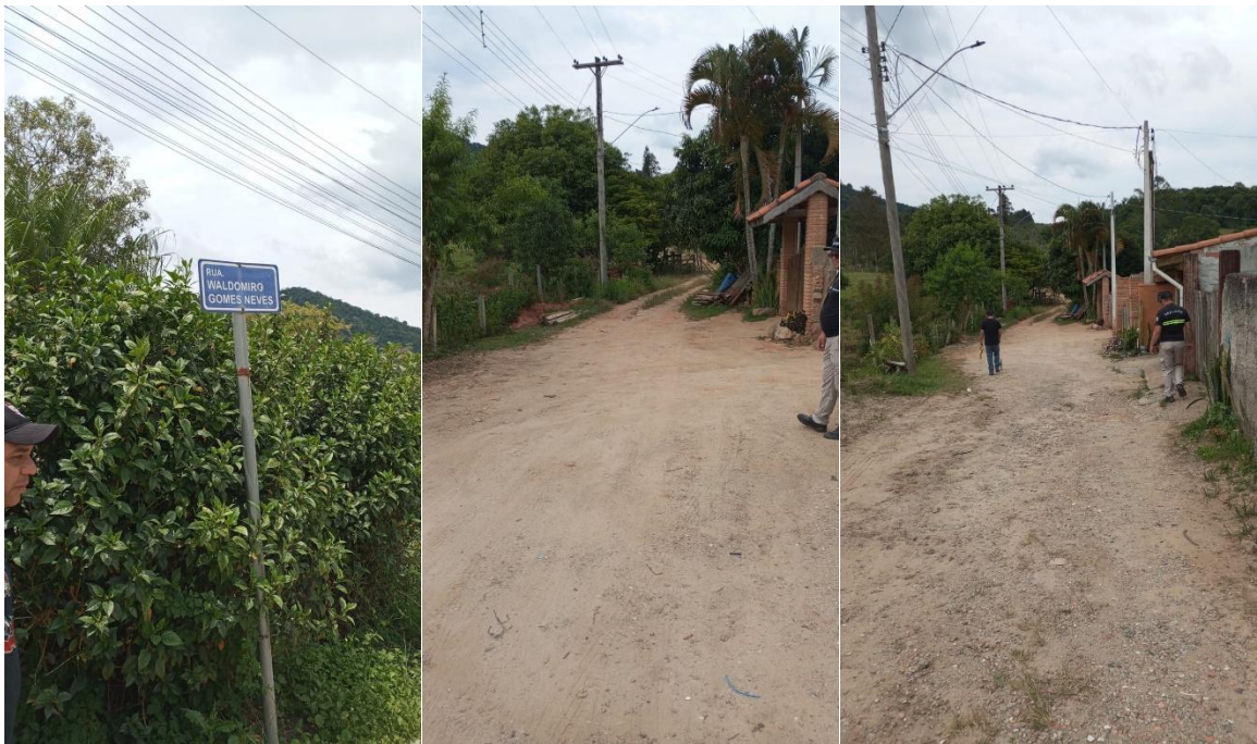
Fotos nº 01, 02,03