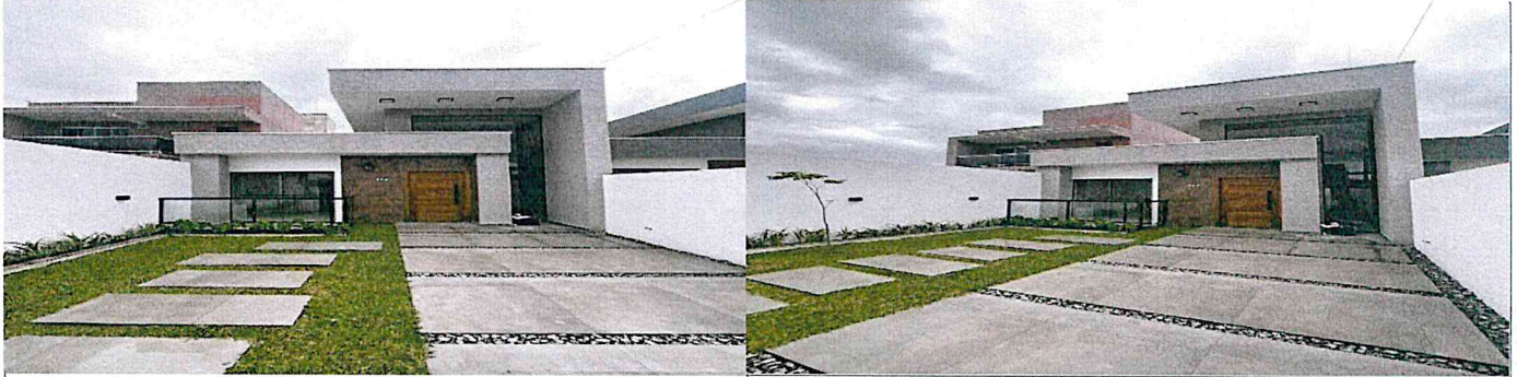
Frente do imóvel