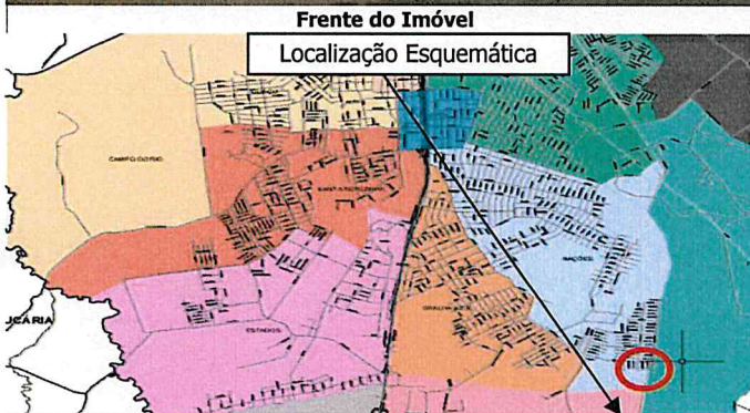
posição em relação à cidade