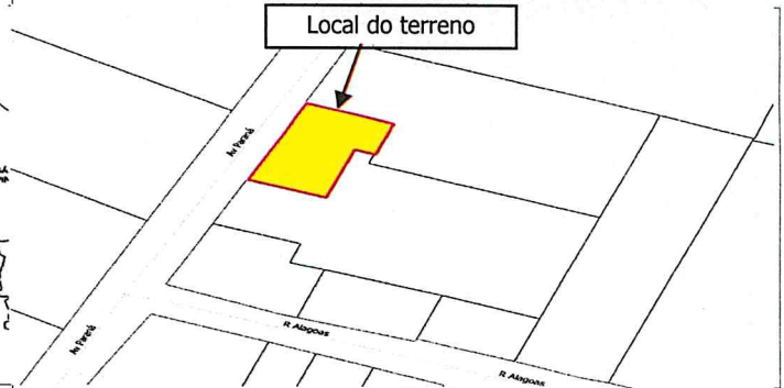
Local do terreno