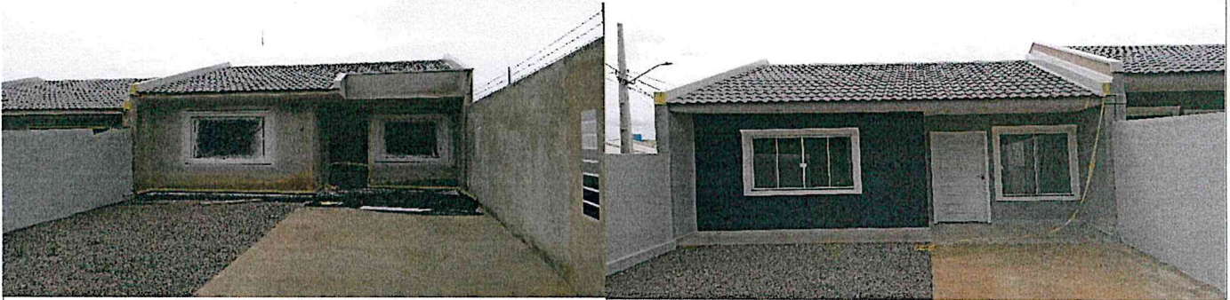
Frente do imóvel