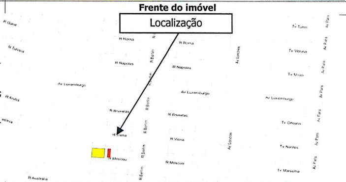
posição em relação à cidade