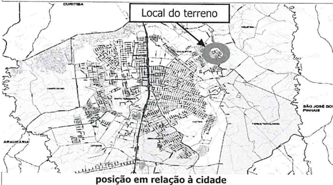
posição em relação à cidade