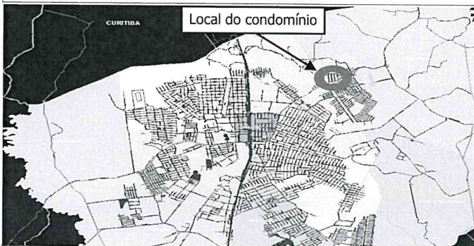
posição em relação à cidade