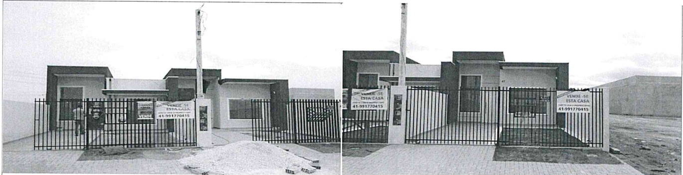
frente do unidade 02