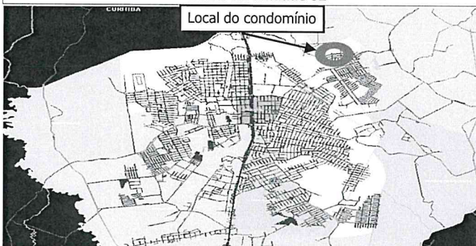
Local do condomínio