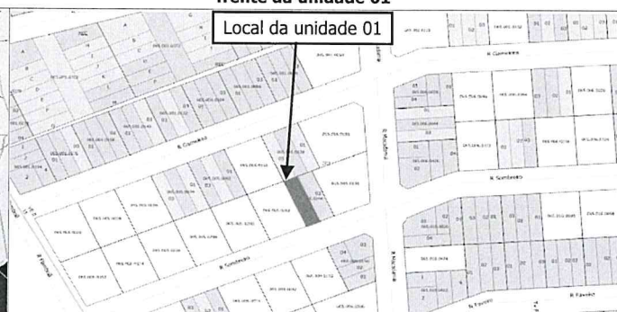
Local da unidade 01