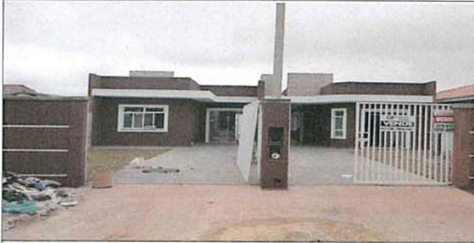
frente do lote