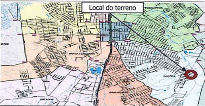
posição em relação à cidade