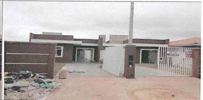
frente do lote