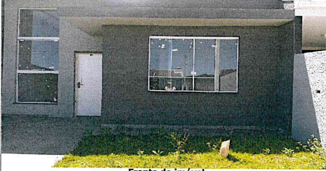
Frente do imóvel