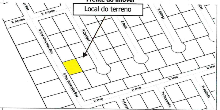
Local do terreno