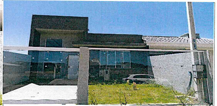
Frente do imóvel