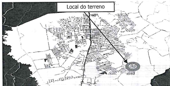
Local do terreno