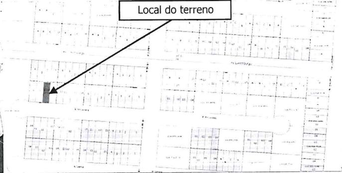
Local do terreno