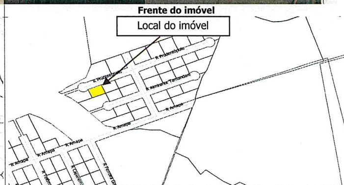
Frente do imóvel Local do imóvel