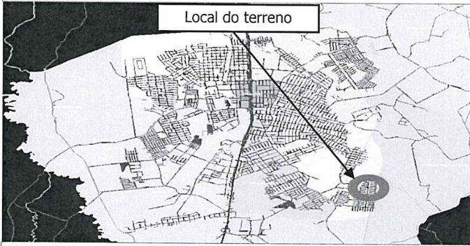
Local do terreno