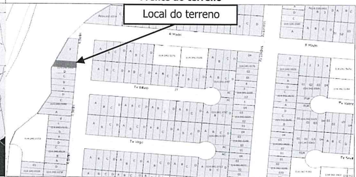
Local do terreno