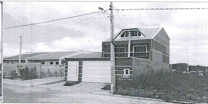
Frente do terreno