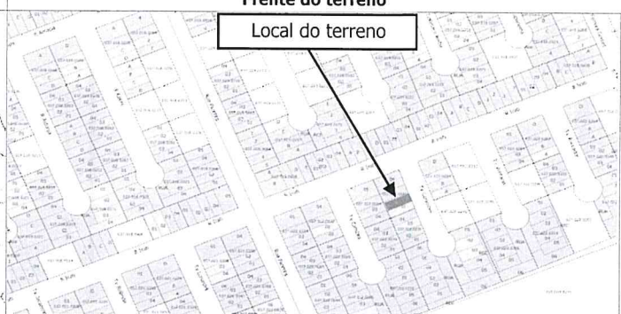
Local do terreno