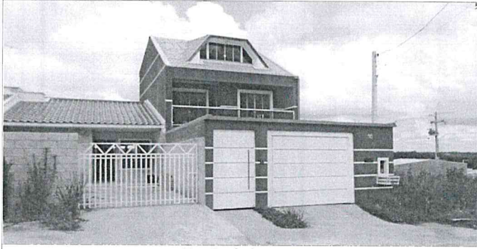
Frente do terreno