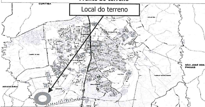
Local do terreno