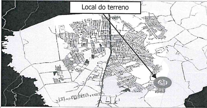
Local do terreno