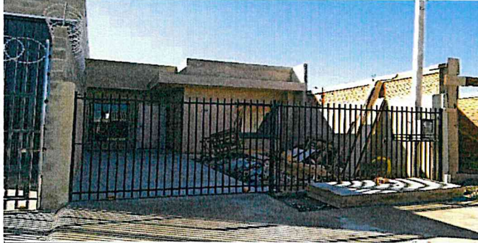
Frente do imóvel