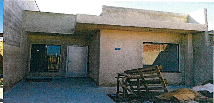
Frente do imóvel