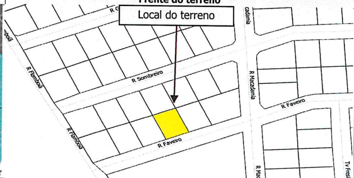
Local do terreno