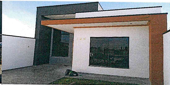
Frente do terreno