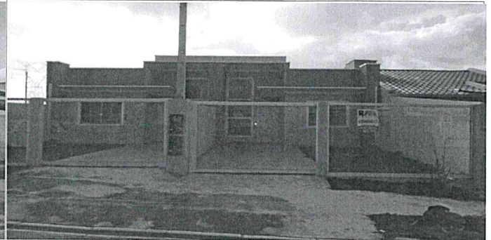
frente do lote