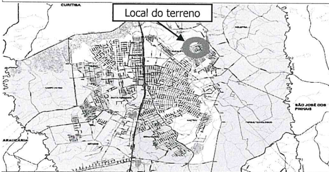
Local do terreno