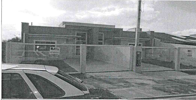
frente do lote