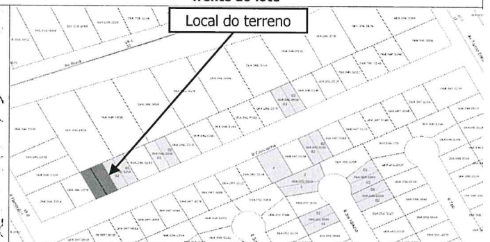
Local do terreno