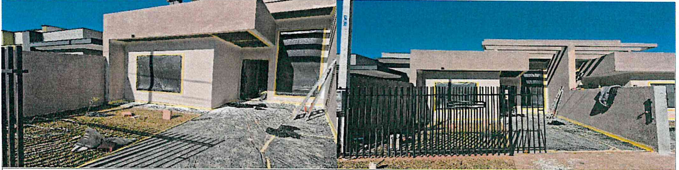
frente do Imóvel