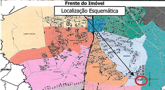
Frente do Imóvel Localização Esquemática