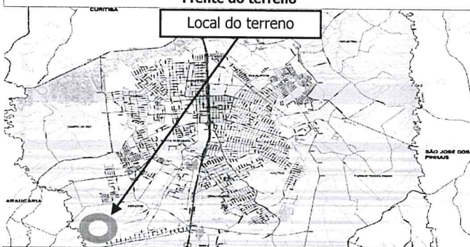
Local do terreno