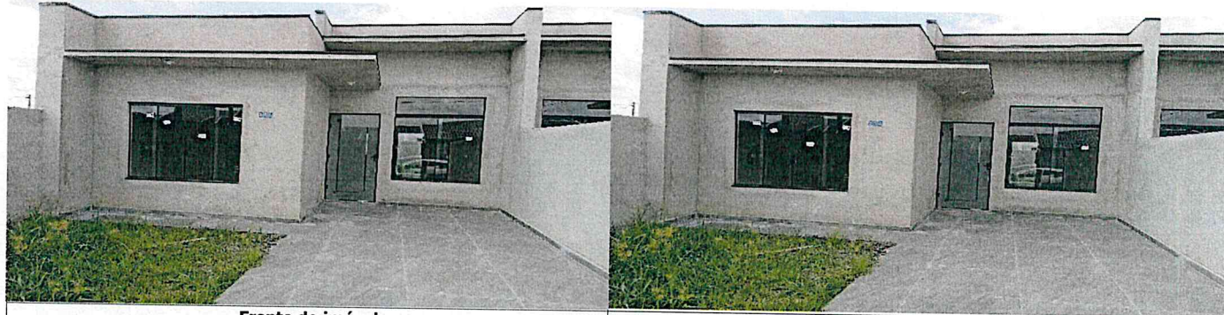
Frente do imóvel