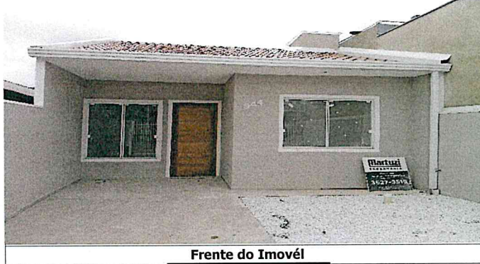
Frente do Imóvel