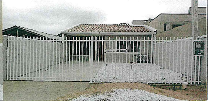
Frente do Imóvel