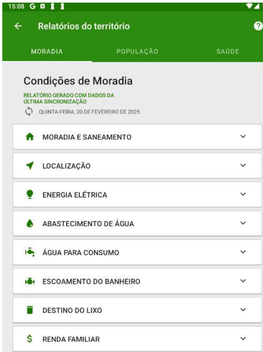
Figura 5.2 - Relatórios do território da equipe: Condições de moradia

O relatório de condições de moradia busca consolidar os registros provenientes dos cadastros domiciliares.