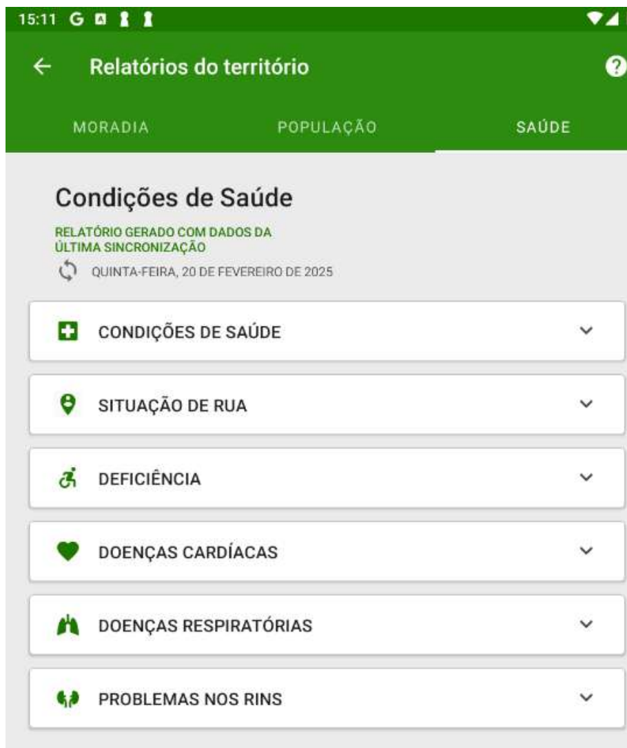
Figura 5.4 - Relatório do território da equipe: Situação de saúde

O relatório de situação de saúde, tem o objetivo de consolidar a situação de saúde do território, com base nos dados coletados na ficha de cadastro individual sobre a situação e condição de saúde do cidadãos adscritos.