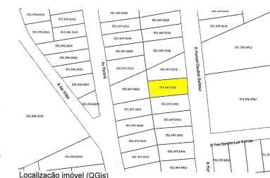
Localização imóvel (QGIS)

Ainda, consta Certificado de Conclusão de Obra nº102/2099 (p.24), de vistoria parcial , referente a conclusão de 03 (três) salas comerciais perfazendo 104,28 m².