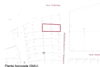
Planta Aprovada (SMU)

Lote de terreno nº03 (três), da Quadra nº 09 (nove), da planta Jardim Canaã, nesta cidade e comarca de Fazenda Rio Grande, com área total de 574,14 metros quadrados, de formato trapezoidal, sem benfeitorias, com as seguintes medidas e confrontações: medindo 15,00 metros de frente para a Rua Rio Ganges , do lado direito medindo 38,78 metros e confronta com o lote nº 01, do lado esquerdo medindo 37,77 metros e confronta com o lote nº 05, de quem da rua olha o imóvel, e nos fundos com a largura de 15,03 metros e confronta com o lote nº02. Medidas e confrontações conforme matrícula. Inscrição imobiliária 051.047.0386.