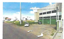
Fig. 05: vista imóvel