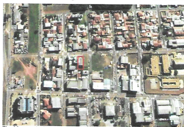
Fig. 02: croquis de localização (Google Earth)