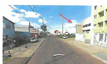
Fig. 06: vista geral Av. Cedro

Da matrícula, conforme AV-11, consta averbação de edificação comercial, com dois pavimentos, perfazendo 602,22 m². Das fichas cadastrais foram levantadas as áreas que seguem: