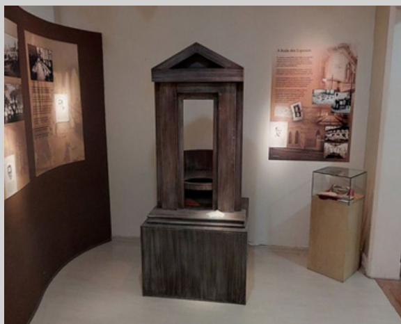
IMAGEM: MEMORIAL DO PEDIATRA

Sobretudo quando olhamos para as meninas, a Proteção Integral garante que elas sejam vistas e cuidadas como crianças, protegendo sua infância de qualquer forma de adultização ou violência, garantindo que sua história não seja mais "girada em uma roda", mas escrita com dignidade.