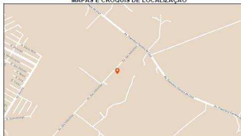
Mapa de Localização (Fonte: Google Maps, 2023)