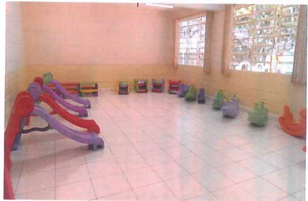
Sala de atividades