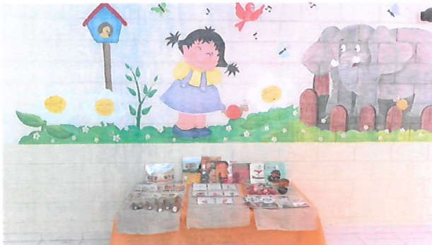
Exposição sobre povos indígenas presente no pátio central.