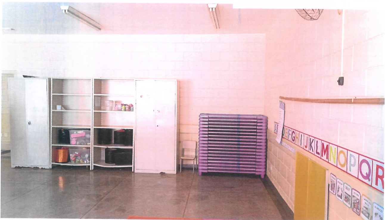
Sala de aula, rotina escolar exposta na lousa e solário

A gestora nos informou que está com projeto para