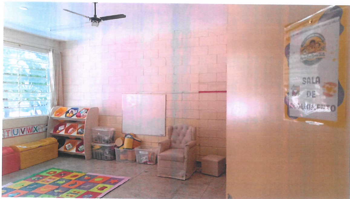
Sala de acolhimento