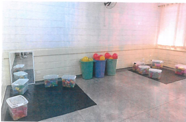
Espaço de exploração de materiais