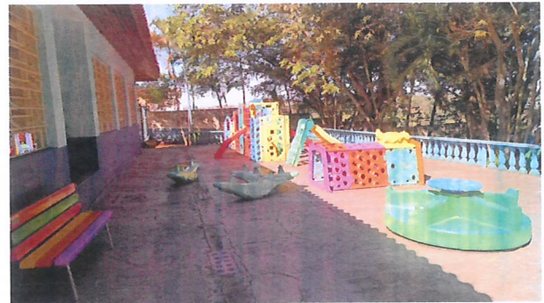
Pátio externo (frente da escola)