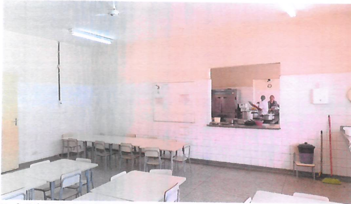
Refeitório 1. ( E.U.E. possui 3)