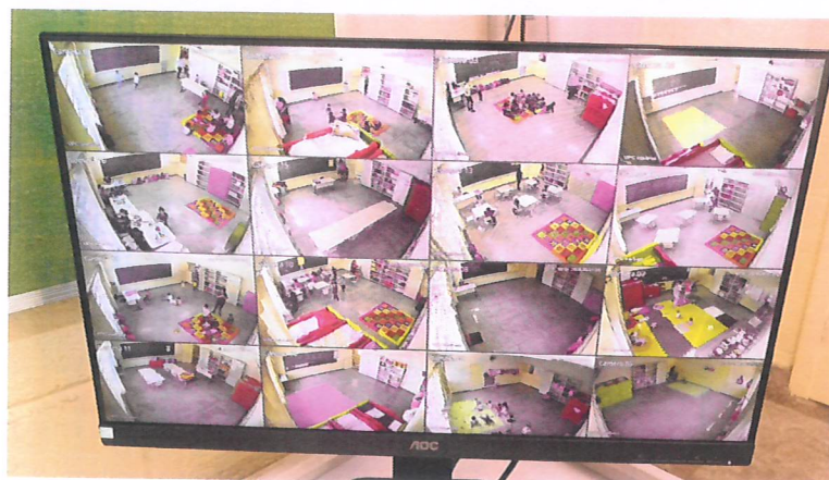
Salas com videomonitoramento