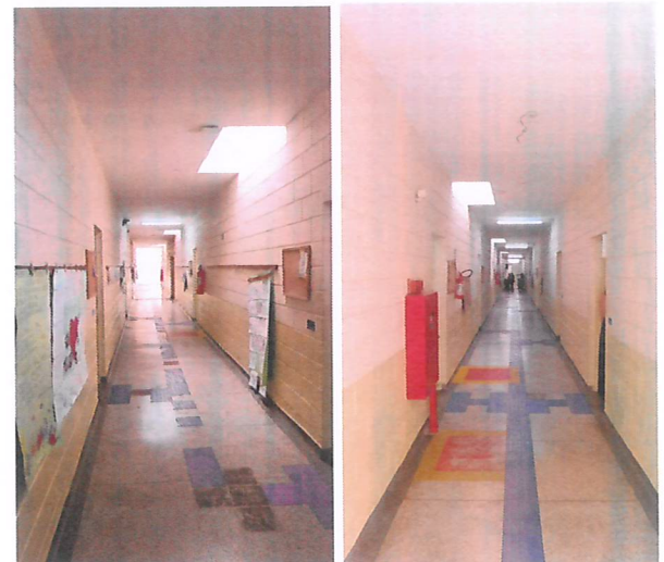
Corredor do lado direito e esquerdo