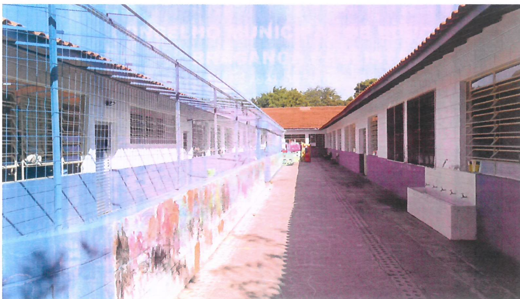
Pátio externo (fundos)