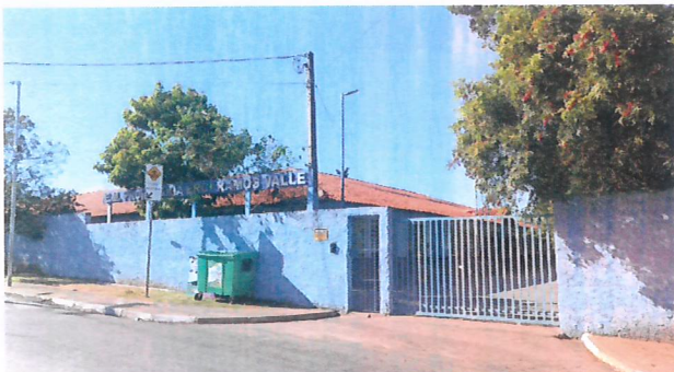
Entrada da unidade.

A escola encontrava-se em ótimas condições estruturais e o trabalho estava regular. A diretora informou que trabalha na escola faz um bom tempo e que a escola está bem melhor em termos de organização e fluência do trabalho pedagógico desenvolvido.