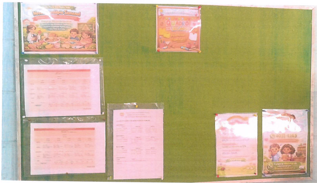
Quadro de informações - Cardápio fixado no quadro externo