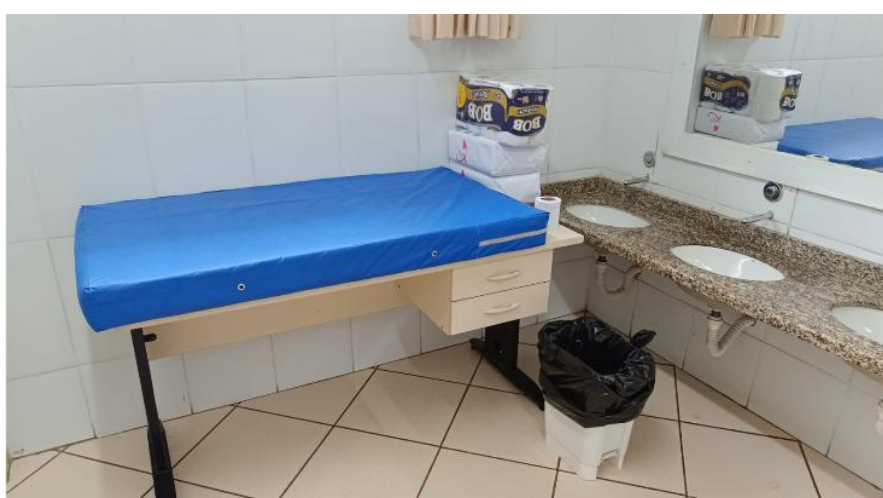
Banheiro com vaso adaptado e trocador (uso esporádico, pois fica próximo às salas de infantil III)

A escola possui QR Code para cada turma, direcionado à comunicação com as famílias.