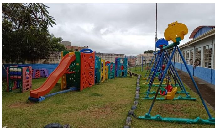
Cardápio fixado no quadro externo e vista do parque externo.