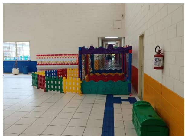
Vista do pátio interno