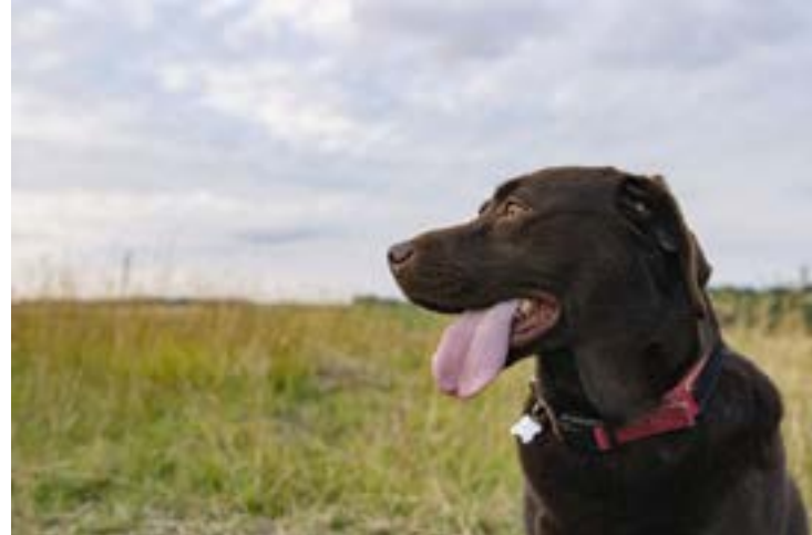
Há muitas variações entre cães da mesma raça

lência e lesões já são centrais. Algumas evidências relacionam essas raças ao status ou