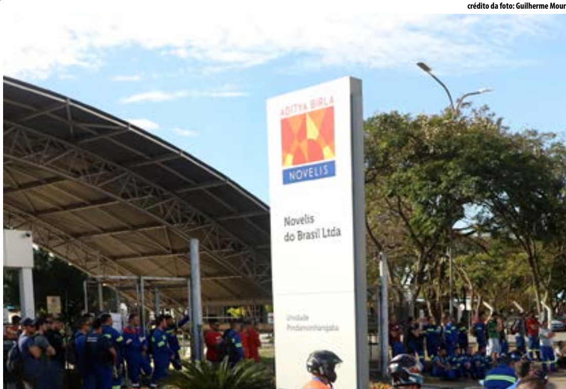
Trabalhadores recebem nesta sexta-feira a primeira parcela da PLR 2023; acordo tem um piso de PLR

A segunda parcela da PLR será em maio de 2024. A Novelis atua no ramo do alumínio e emprega atualmente 1.500 pessoas em Pinda.