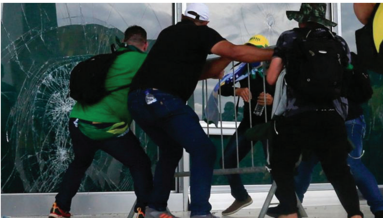
Apoiadores de Jair Bolsonaro quebram vidro do Supremo Tribunal Federal durante invasão do edifício

A ordem só foi restabelecida na região após a chegada de reforços. Como consequência da invasão, o presidente Lula anunciou, no final da tarde, a intervenção federal na segurança pública do Distrito Fede-