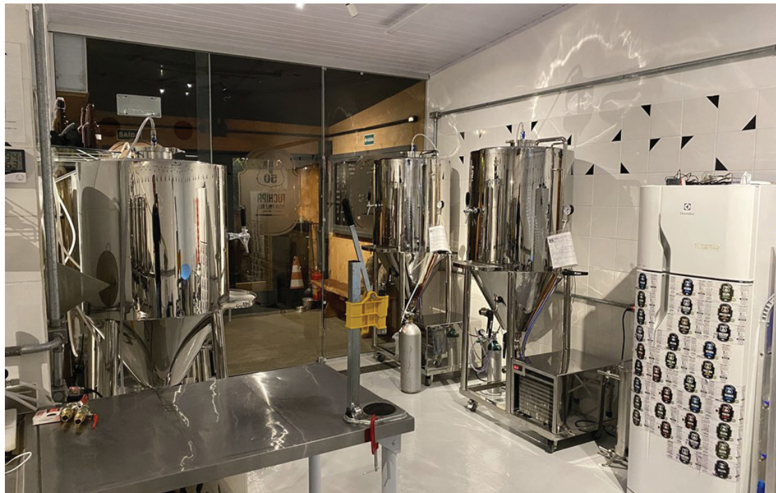
Instalações da cervejaria SP-50 no distrito de São Francisco Xavier