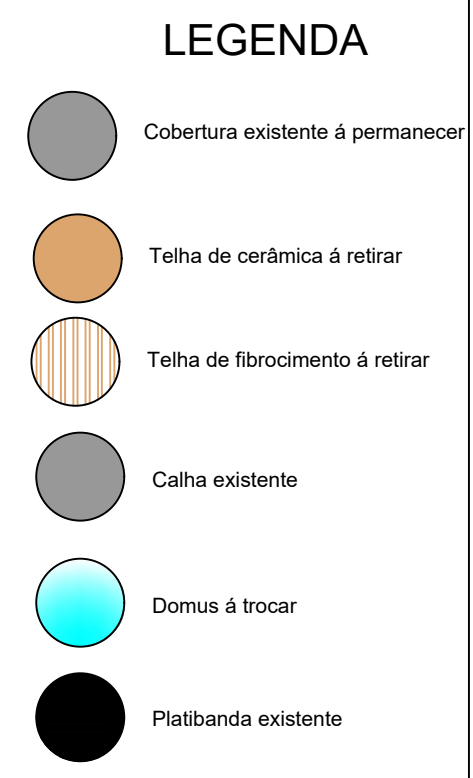
PROJETO COBERTURA ESC.: 1/100