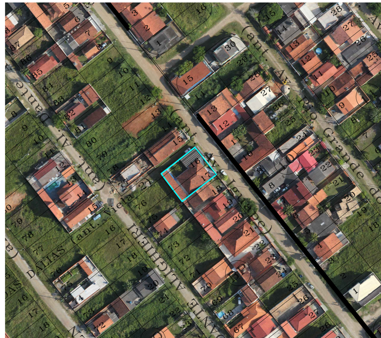
ESF MEU RECANTO