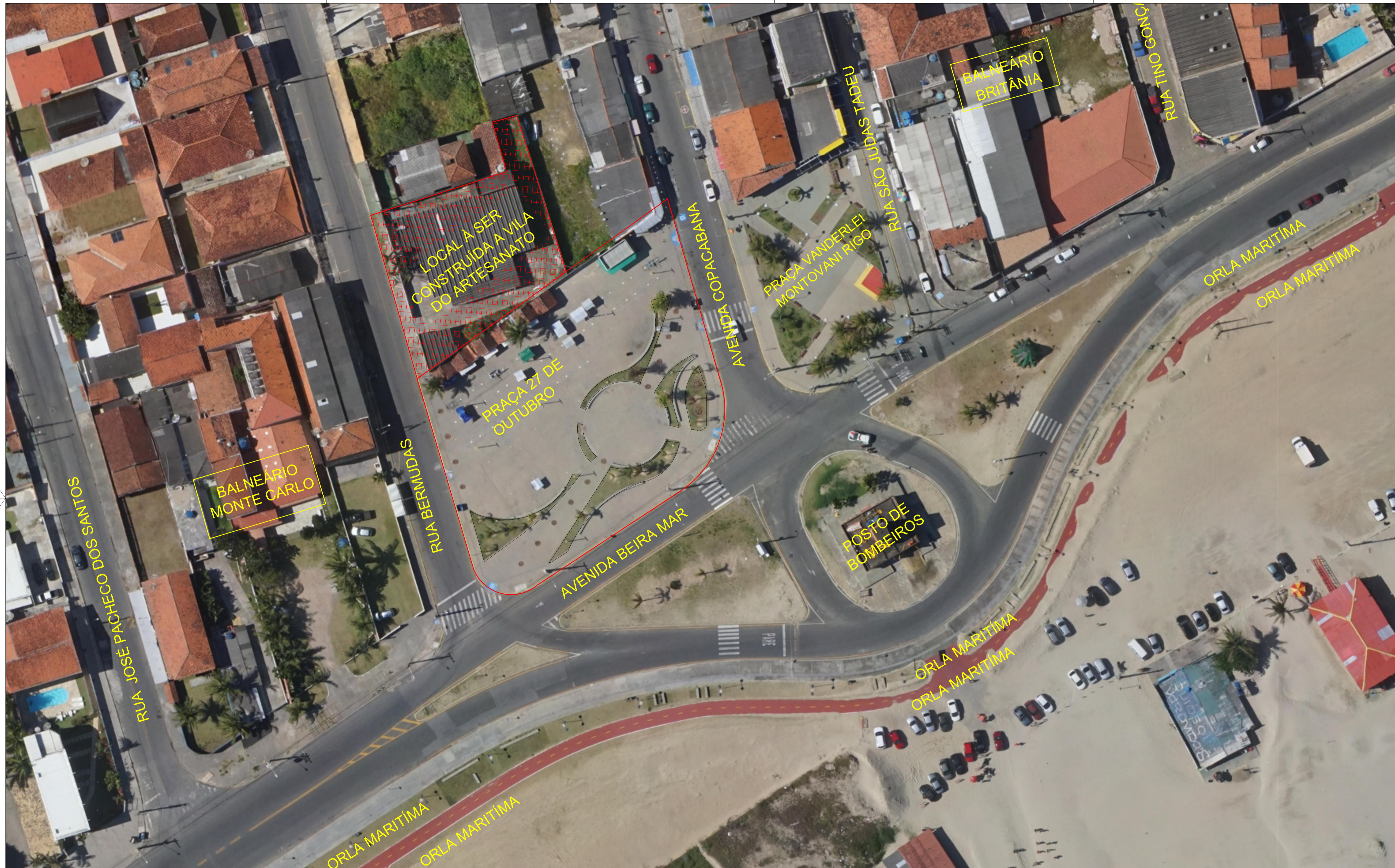
PLANTA LOCALIZAÇÃO - VILA DO ARTESANATO