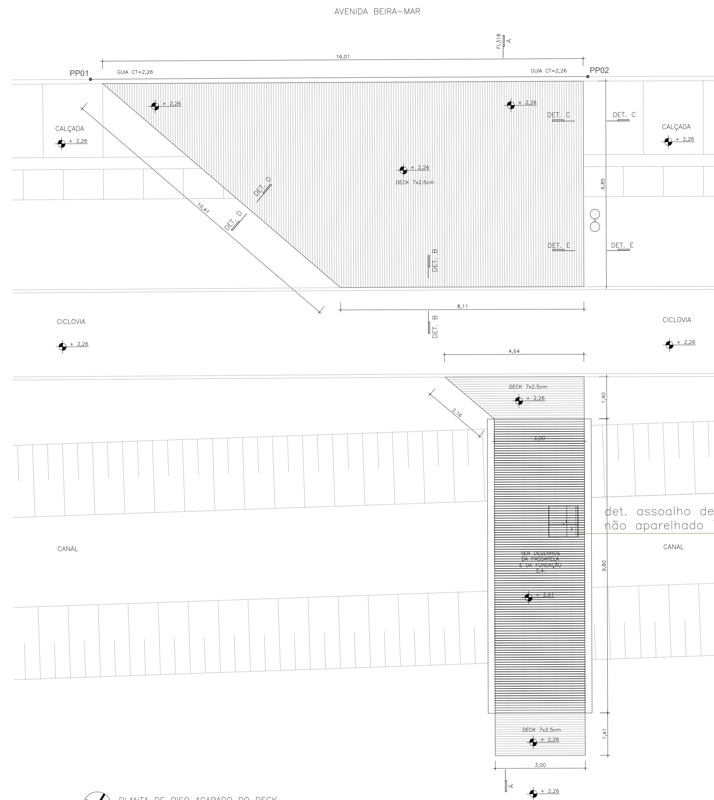
PLANTA DE PISO ACABADO DO DECK ESCALA 1:75