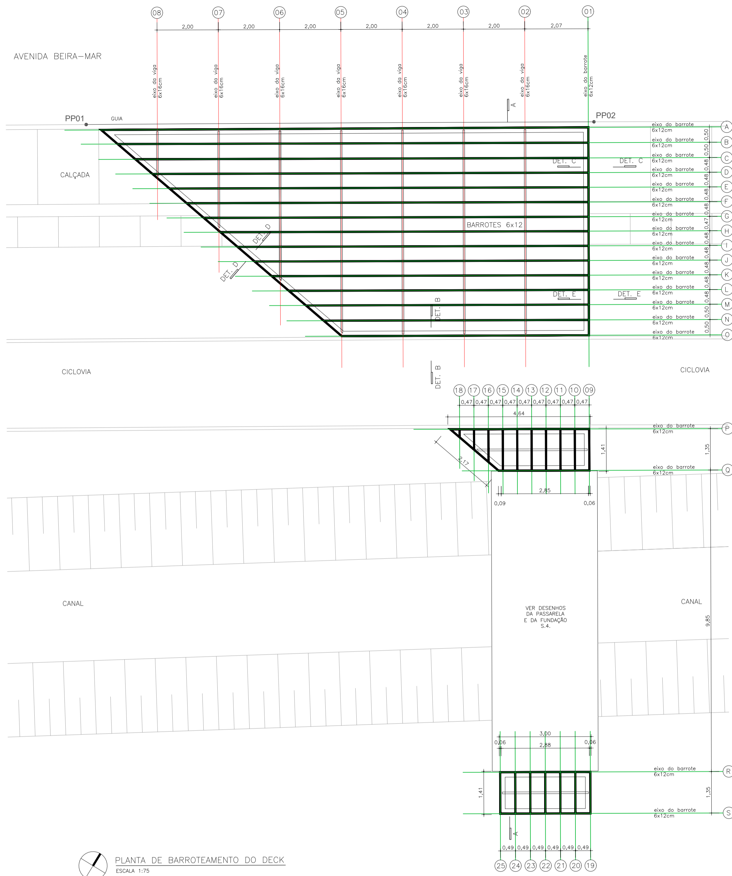
PLANTA DE BARROTEAMENTO DO DECK ESCALA 1:75