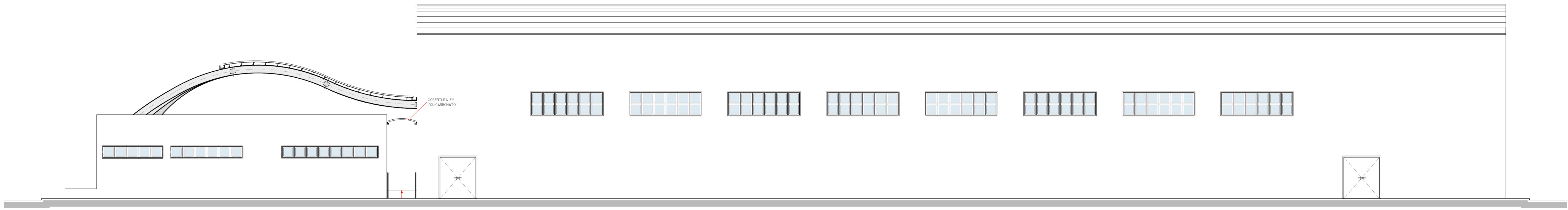
QUADRA POLIESPORTIVA E AUDITÓRIO VISTA 3