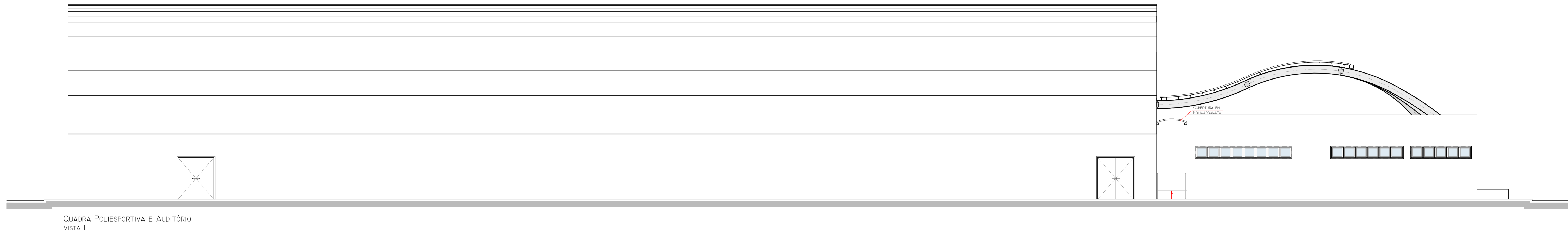
QUADRA POLIESPORTIVA E AUDITÓRIO VISTA 1