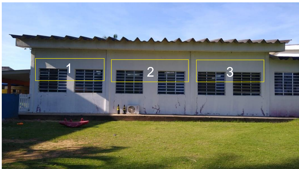
Salas 8 e 10. 3 toldos