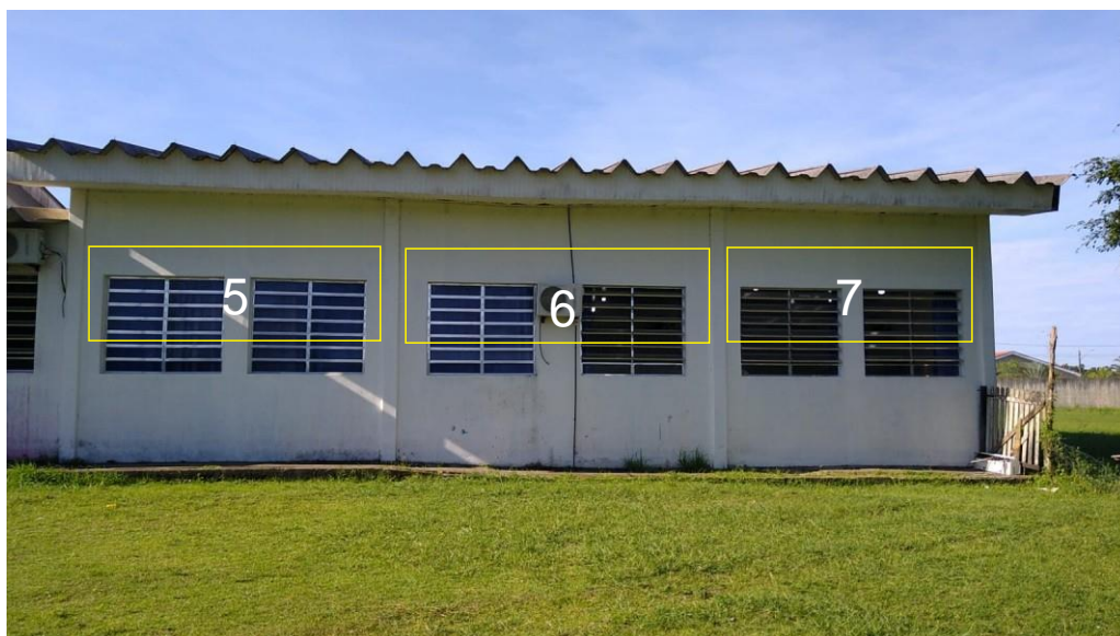
Salas 12 e 14. 3 toldos